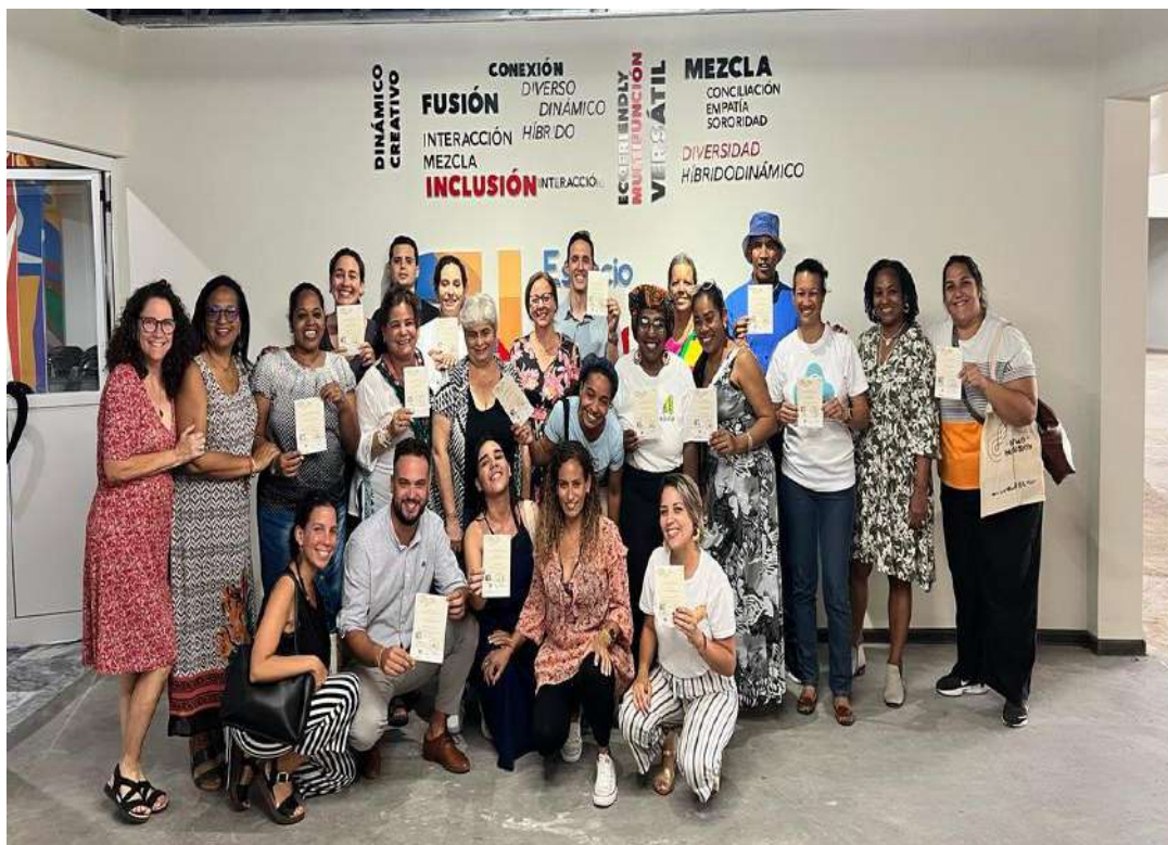
Imagen 1: Grupo de la 3era edición del Diplomado Desarrollo Local y Comunitario: la cultura como factor de integración (CIERIC-FLACSO)