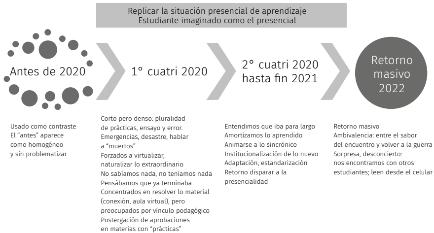
Esquema 1. Las temporalidades del proceso de virtualización según los y las docentes entrevistados.

Así, fue recurrente en los testimonios docentes las alusiones a dificultades organizativas (docentes con diferentes disposiciones y saberes para usar herramientas virtuales); institucionales (disponibilidad de aulas virtuales, no contar con listados de alumnos, indefiniciones sobre la acreditación de la materia, incertidumbre sobre la realización de actividades presenciales) y de infraestructura (conectividad de estudiantes y docentes). Los y las informantes destacan el «esfuerzo para que la universidad siga abierta» pero también cuestionan la «lentitud» en la definición institucional del calendario académico y las modalidades de evaluación, en un contexto marcado por las dificultades para garantizar cuestiones nodales de la práctica educativa (acceder al edificio para usar laboratorios, biblioteca o instrumental específico; las modalidades y tiempos de las evaluaciones).