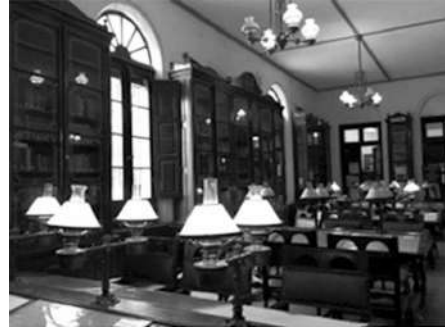
Imagen 1 y 2. Pizarrón e interior de la biblioteca del Colegio Superior «Justo José de Urquiza» de Concepción del Uruguay, Entre Ríos.

los nombres son intertextos que dan cuenta de la importancia de la polifonía y el diálogo en los procesos de enseñanza y aprendizaje. En la instancia de acreditación del seminario, se propuso optar por una de ellas.