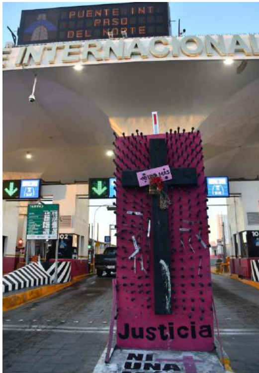
Fotografía 2. Cruz con clavos en la garita Paso del Norte, Ciudad Juárez, Chihuahua. Enero de 2024