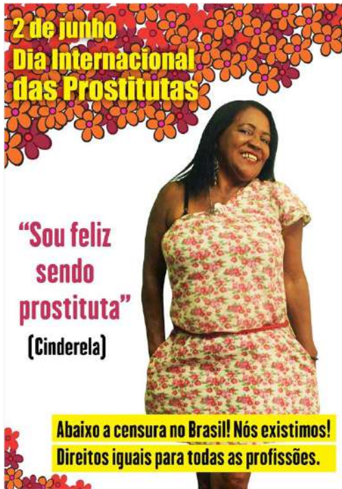
Imagem 5. Cartaz feito pelo movimento de prostitutas. 2011