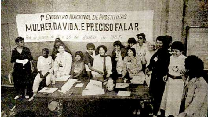
Fotografia 1. Primeiro Encontro Nacional de Prostitutas. 1987