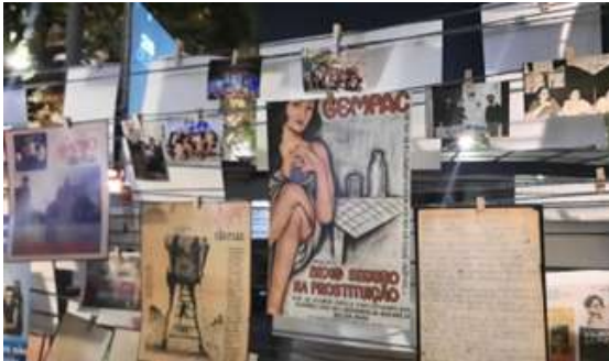
Fotografia 13. Teia de memórias. Festival “Be Yourself”. 2022