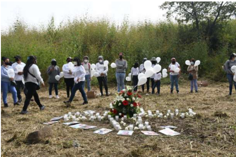
Fotografía 1. Segundo aniversario del encuentro de las fosas en Salvatierra, Guanajuato, 4 de noviembre de 2022