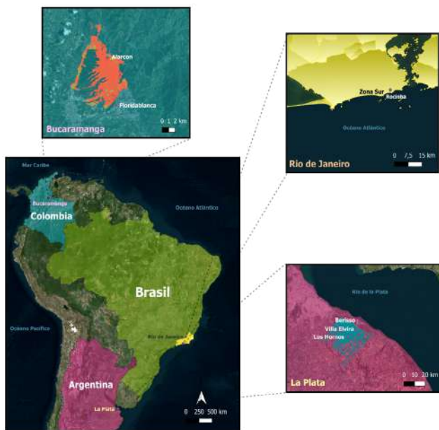
Mapa 1. Lugares de residencia de los entrevistados

jóvenes de ambos sexos, con edades entre 18 y 26 años, residentes de ciudades como Río de Janeiro (6), La Plata (7) y Bucaramanga (9), todas ellas capitales importantes en sus respectivos países. En Río de Janeiro, se entrevistó a un grupo de jóvenes católicos residentes de la favela Rocinha , un barrio periférico en el corazón de la zona sur de la ciudad. En La Plata y Bucaramanga, se seleccionaron jóvenes residentes en barrios periféricos esparcidos en ambas ciudades (ver mapa 1). El criterio de selección no se limitó únicamente a considerar su ubicación en barrios periféricos. También se tomaron en cuenta aspectos relacionados con su vulnerabilidad laboral, priorizando a aquellos que informaron tener empleos múltiples, trabajos precarizados a través de aplicaciones sin garantías laborales o seguridad, o empleos informales (ver tabla 1).