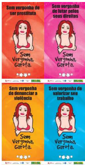
Imagem 4. Adesivos da campanha promovida em parceria com o Ministério da Saúde. 2002

articulava saúde e direitos humanos em uma crítica contundente à abordagem histórica higienizadora e biopolítica, em que eram consideradas transmissoras de doenças, noção reatualizada internacionalmente nas políticas de prevenção. Longe de se reduzirem ao campo da saúde, compreendiam a parceria com o Ministério da Saúde como estratégica para a sustentabilidade de suas ações, voltadas para a promoção de direitos e cidadania. Na relação tensa e duradoura com o Ministério da Saúde, chegaram a contribuir para a criação de campanhas de prevenção perspicazes que valorizavam a profissão, como o lema do projeto Sem vergonha, garota. Você tem profissão , promovido em 2002.