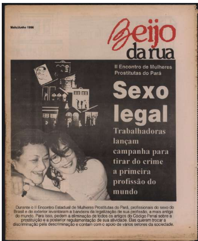
Imagem 3. Capa do Jornal Beijo da rua