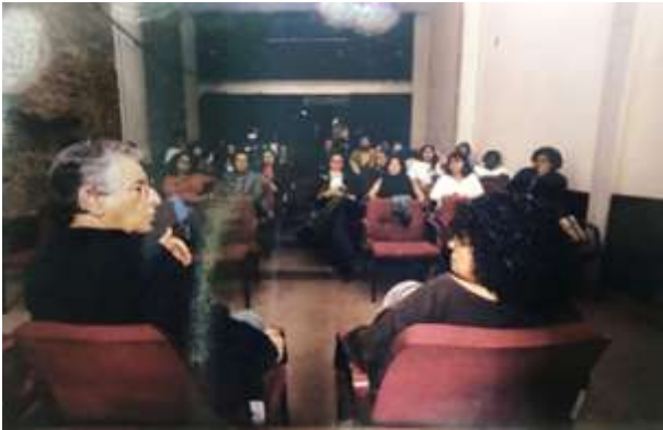
Fotografia 7. Gabriela Leite e Fernando Gabeira. Encontro de Profissionais do Sexo do Rio de Janeiro, 2003

anteriores com o deputado federal Fernando Gabeira (PT-RJ) se materializou em um documento definidor dos próximos passos da categoria: “Apoiar o projeto de lei, de autoria do deputado federal Fernando Gabeira (PT-RJ) que formaliza a existência dos serviços de natureza sexual e torna legal a relação de trabalho entre empresários e profissionais do sexo.” (Beijo na rua, outubro, 2003, p.4).