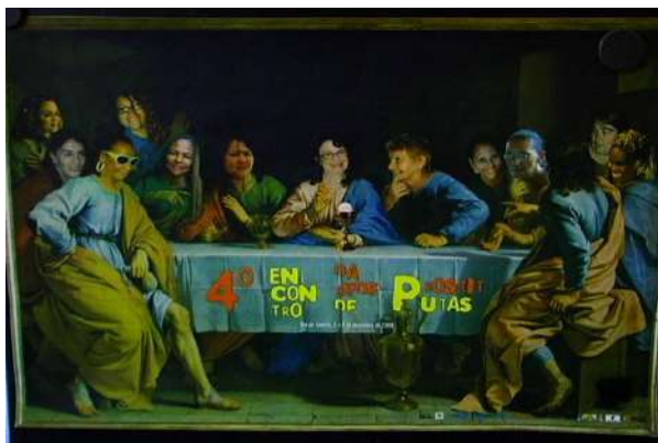
Imagem 2. Cartaz do IV Encontro da Rede Brasileira de Prostitutas. 2008

pelos protagonismos de lideranças e as questões subtematizadas que não ganharam a cena dos principais debates políticos. Por muito tempo, o movimento de prostitutas traduziu uma maior presença de pessoas brancas, sudestinas e cisgênero nos cargos de liderança e nas representações. Portanto, fabular criticamente a teia documental é uma tarefa necessária, considerando as lacunas que também habitam a história do movimento. Afinal, a constituição do arquivo se deu desde uma perspectiva do sudeste brasileiro, a partir de recursos e olhares predominantemente conduzidos por pessoas brancas e cisgênero. Nesse sentido, uma das linhas de investigação do exercício cartográfico foi a de percorrer as brechas do Arquivo Davida, encontrando documentos e protagonismos das prostitutas negras, travestis, trans, e de outras regiões do Brasil, e suas contribuições à luta.