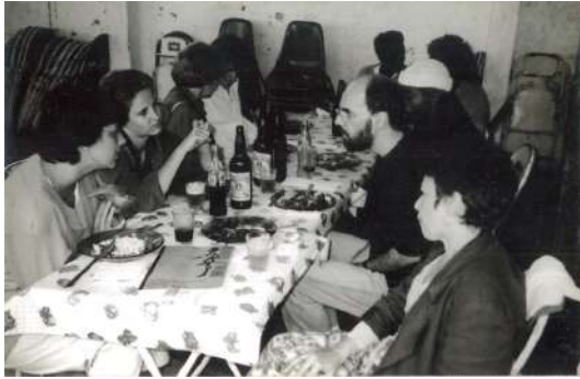
Fotografia 3. Fundação da ONG Davida. 1992