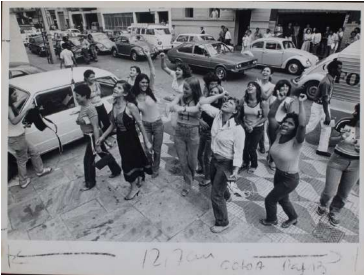
Fotografia 6. Manifestação de prostitutas contra a violência policial no centro de São Paulo. 1979