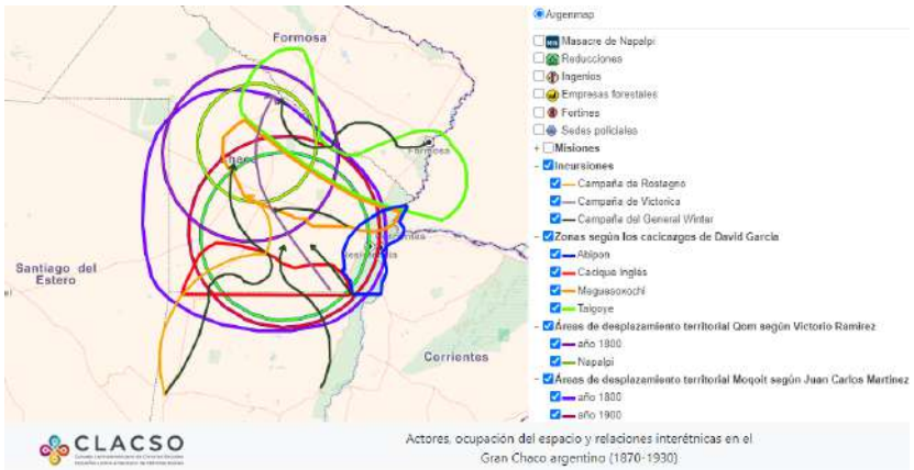
Mapa 2. Actores, ocupación del espacio y relaciones interétnicas en el Gran Chaco Argentino (1870-1930)