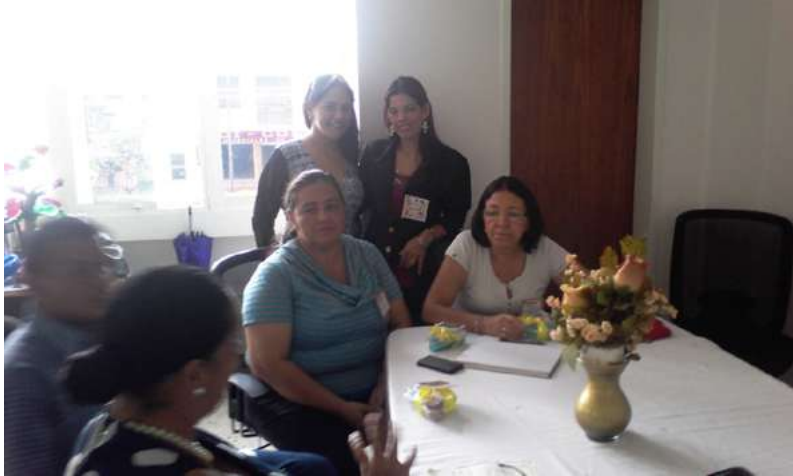
Foto 2. Visita de acompañamiento a la Vinculación Profesional Bolivariana