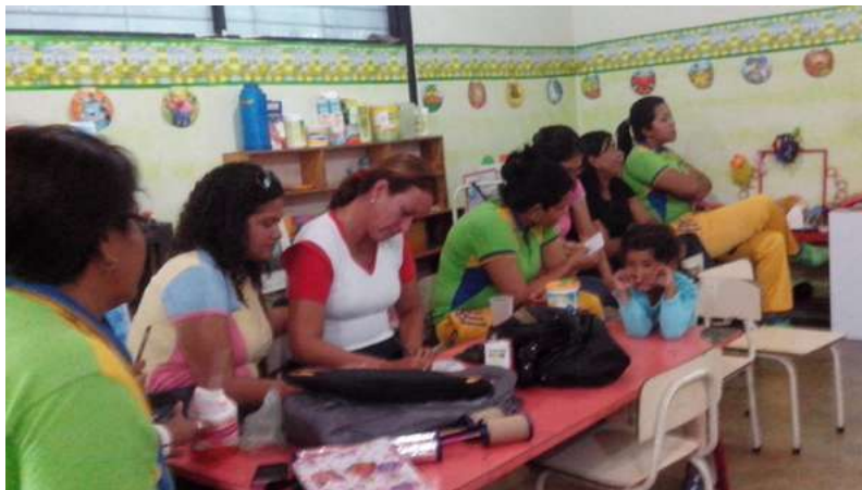
Foto 3. Taller de sensibilización pedagógica