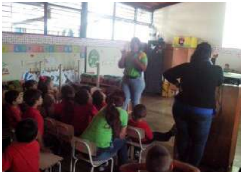
Foto 6. Compartir pedagógico con niños y representantes.