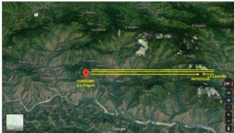
Figura 7. Mapa La Fragua-Vereda Santa Águeda-La Ciénaga.

Si se mira un mapa de la región, tratando de ubicar las tres ocasiones en que Robledo hace el viaje entre el lugar donde establece el real y la laguna, se pueden ubicar tres lugares significativos: Currume (La Fragua, el real), Santa Águeda (donde es fundada Antioquia) y la finca La Ciénaga (donde está la laguna) (figura 7 y 8).