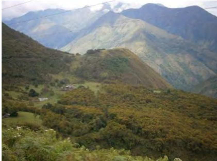
Figura 4. Finca La Ciénaga, vereda Santa Águeda. La laguna a la izquierda