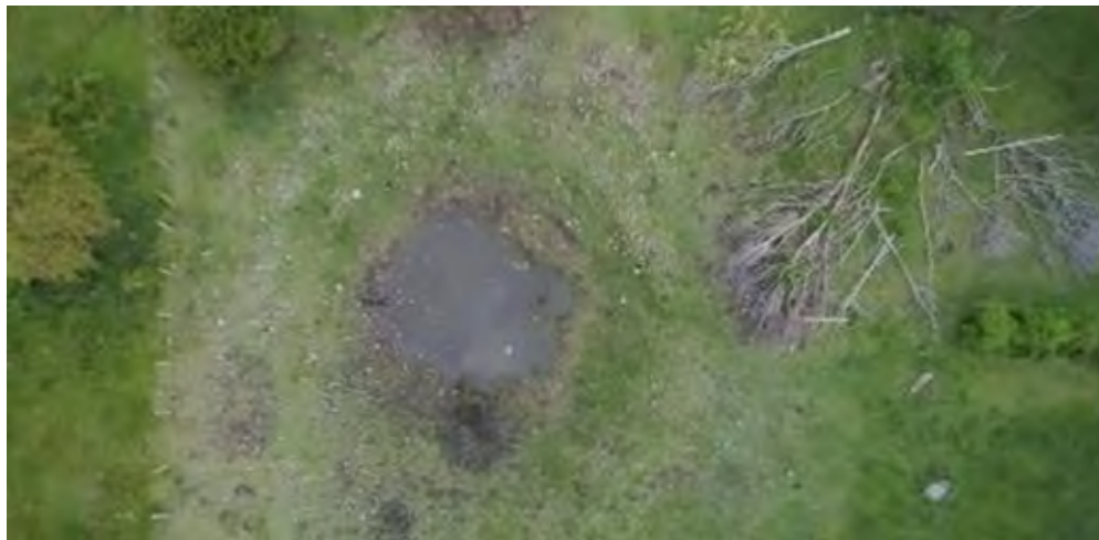
Figura 5. La laguna desde un dron. (Por el rastro de piedras en torno a la laguna, se deduce que su diámetro era mayor)