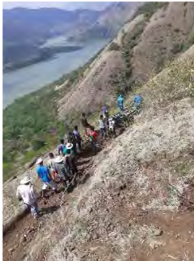
Figura 2. Las sierras descabezaban en el río. Escena del transporte de una canoa a la hidroeléctrica de Ituango, desde Loma del Sauce a Barbacoas, Peque

El paso del río demoró ocho días (eran 79 españoles a pie y a caballo, más los indios y negros que llevaban de servicio, más los curas, más los caballos y el bagaje). El río en ese punto no tenía playa, las montañas caían directamente en él, así que tuvieron que subir la sierra, hasta los 1800 metros sobre el nivel del mar.