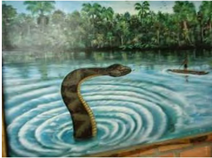
Figura 1. Mito fundacional Achagua, Puerto López, Meta