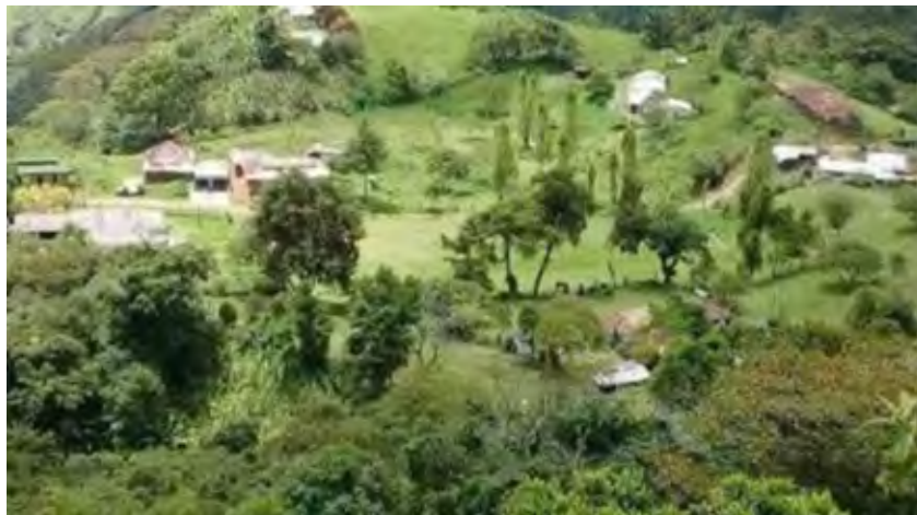
Figura 6. Vereda Santa Águeda – Peque, sitio de fundación de la ciudad de Antioquia

Y no me sintieron hasta que estuve en lo alto [de la loma de la cruz], lo cual tuvimos por gran milagro que Dios quiso obrar conmigo y con lo que allí iban y así los desbaratamos e hicimos huir porque luego subimos los caballos y me fui al asiento donde fundé la ciudad 24 .