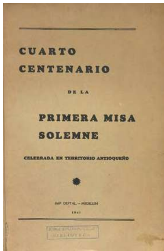
Figura 3. Carátula de la edición que se encuentra en la Biblioteca eafit

Y crece la extrañeza ante aquel cuervo, tan manso y apacible en medio de estas selvas salvajes, que no se mosquea con el fuerte movimiento, ruido y afluencia de tanto soldado con su caballería, equipo de guerra, indios, etc. Y la acción del cuervo en el momento más solemne tiene todas las apariencias de una fábula grosera e irreverente, inventada con fines puramente burlescos y de tramoya. Por otra parte ¿hay seguridad de que Robledo pisó este suelo en su excursión conquistadora hacia el norte? Existe una teoría, hoy en boga, y sostenida por historiadores serios como el Dr. Gómez C., que no admite el paso de Robledo por este valle nuestro hasta el año 1546, cuando, de regreso de España, 'provisto ya de su título de Mariscal de Antioquia, y en viaje hacia el sur donde le aguardaba la muerte, fundó en este precioso valle la villa de Santafé.