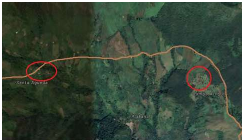
Figura 8. Ubicación de la laguna (La Ciénaga) y de la Vereda Santa Águeda, Peque