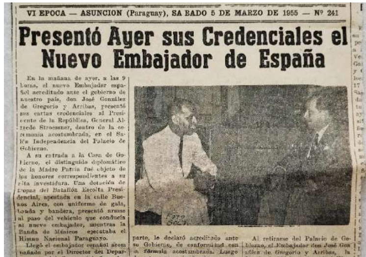
Figura 1. Presentación de credenciales de González de Gregorio a Stroessner, 1955

Las diferencias en la elección de las fotografías del diario Patria , vocero del régimen stronista, para dar las noticias sobre la toma de posesión de González de Gregorio en 1955 y de Giménez Caballero en 1958 resultan particularmente elocuentes (Figura 1 y Figura 2).