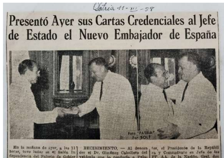
Figura 2. Presentación de credenciales de Giménez Caballero a Stroessner, 1958