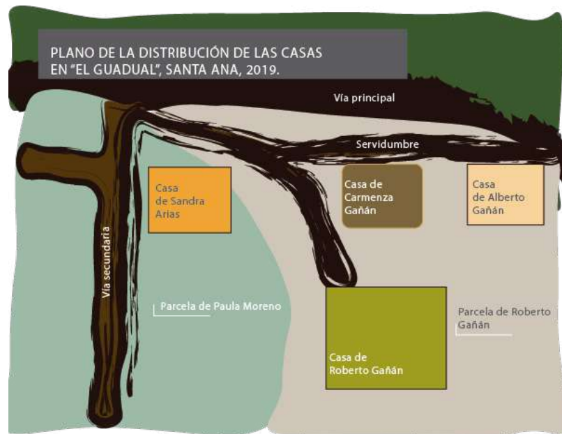
Figura 1. Distribución de las viviendas y la ocupación de esta parcela plurifamiliar El Guadual

Fuente: Lara-Largo, «Imbrications identitaires. Les usages ethniques du territoire à Guamal, Caldas, Colombia», 325.