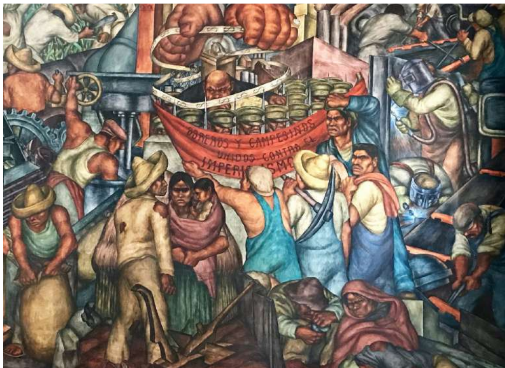
Figura 1. La industrialización del campo