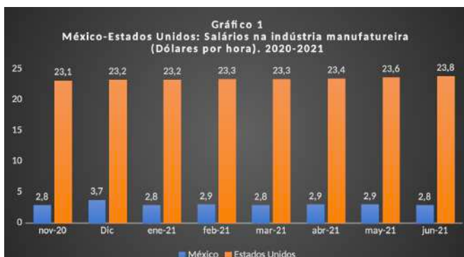
Gráfico 1. México – Estados Unidos: salários na indústria manufatureira (dólares por hora), 2020-2021

El ECONOMISTA (17 de octubre de 2021). Comparación de Salarios en México y E.U.A: Manufactura.