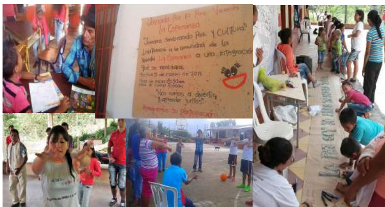
Fotografía 15. Somos sujetos actuantes. Acción colectiva en la vereda La Esperanza.

su intencionalidad primordial: un conocimiento que fuera capaz de buscar el bien a través de un quehacer situado, de una ética del cuidado de sí, de los otros y del mundo. La evaluación hecha por los asistentes da cuenta del potencial que la comunidad percibió en los/as jóvenes y de cómo la visión de los adultos se abre a la importancia de la participación juvenil en la vida social. También evidencia una alta valoración de la fuerza creadora de los/as jóvenes y la importancia de escuchar sus voces y aprender de las nuevas generaciones de constructores y constructoras de paz.