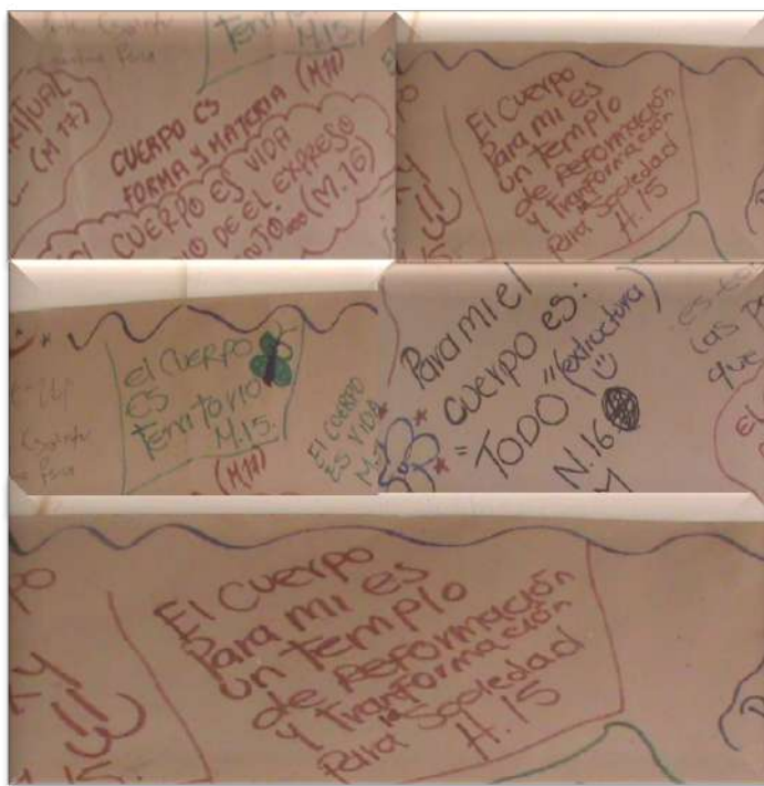
Fotografía 9. ¿Qué es el cuerpo?

jadas a lo largo del proceso que permitieron a través de cartografías corporales, ejercicios sensoperceptivos, biografías corporales, recursos audiovisuales y fotográficos, entre otras mediaciones, profundizar en las estéticas de los cuerpos, en su emocionar, en su relacionamiento con otros cuerpos y en las preguntas por el existir y por cómo habitar el mundo.