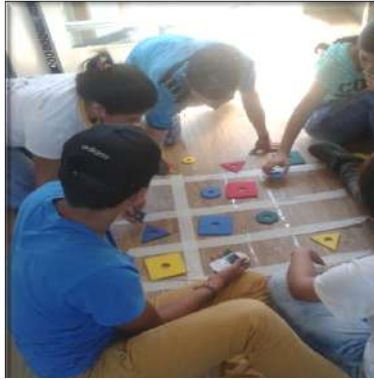
Fotografía 5. Siga la pista.