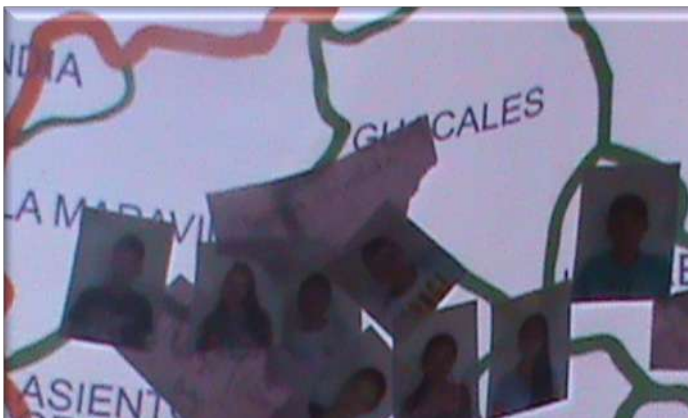
Fotografía 7. Un territorio con rostros singulares.

Los hallazgos obtenidos, dieron como resultado un complejo ejercicio cartográfico en el que el territorio se reveló como categoría existencial donde surge su condición de sujeto político. El territorio se presenta, por un lado, como encuentro entre el individuo y la colectividad; y por otro, como encuentro entre la historia personal (experiencia personal) y la historia social (experiencia colectiva). En ese momento, integramos sus rostros en la cartografía, para lo cual dispusimos de un mapa a gran escala del municipio, para integrar espacios, objetos y sujetos.