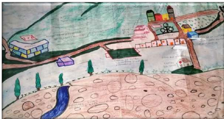
Fotografía 4. Dibujo, el espacio representado.

y pese a que por su edad su entrada está restringida, se las ingenian para ingresar.