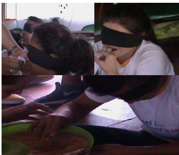
Fotografía 12. Oliendo... Gustando... Tocando.

cada sensación. Observamos expresiones de asombro, de inquietud, muecas, gestos, estremecimientos del cuerpo, de aceptación o de rechazo. En la conversación con el grupo, posterior a esta exposición sensorial, sus intervenciones primeras se situaron en diferenciar aquellas sensaciones que consideraban agradables y las que les resultaron desagradables. Hubo diferencias de opinión, específicamente en cuanto a lo olfativo, lo gustativo y lo táctil, aunque también encontramos en los “gustos”, sobre todo en aquellas sensaciones familiares. En lo auditivo y lo visual encontramos muchas más concordancias, quizás por ser sentidos más sociales y los primeros más íntimos, como veremos en el segundo capítulo.