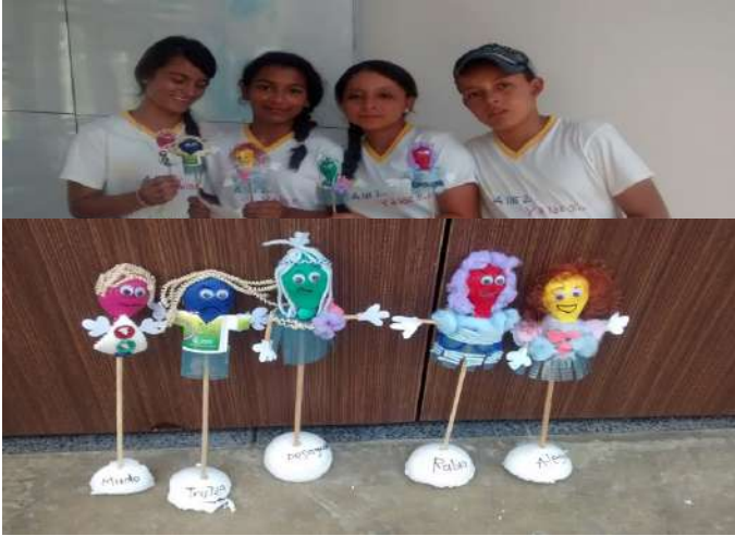
Fotografía 11. Teatralizando las emociones.

El emocionar es para ellos y ellas reconocimiento de la vida, de la fragilidad humana, pero también de la fragilidad del bien en una humanidad capaz del mal. Sus heridas y cicatrices son morales. Las heridas físicas y sus correspondientes cicatrices son solo recordatorios eventuales de cómo las violencias han dejado marcas en su cuerpo. Destacan con mayor intensidad las heridas y cicatrices personales, es decir, aquellas que se generan en sus relaciones más próximas, con la familia, los amigos, los compañeros y las parejas. Las heridas se encarnan no solo en el cuerpo-carne, sino en toda su experiencia simbólica corpórea. En la unidad de la carne el dolor permanece. Las heridas mejoran con el tiempo, ya no sangran, pero las cicatrices se hienden para siempre en la propia carne.