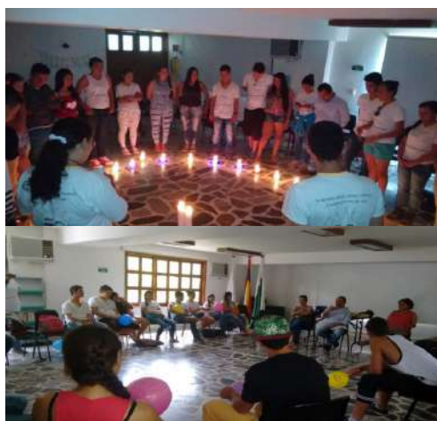
Fotografía 16. Ritual de cierre y evaluación con la administración municipal.

lo que me gusta y no me gusta, las valoraciones que hago y cómo puedo valorar más las cosas”, “He conseguido nuevos amigos en mi territorio, con los cuales puedo compartir y trabajar por el municipio”, “Creo que necesitamos compartir esta experiencia tan importante con otras personas de la comunidad”, “Aprendí la importancia de respetar más las opiniones ajenas, y en general, respetar las diferencias”, “Aprendí mucho sobre la tolerancia, sobre valorar y comprender mejor al otro; ayudarlo más”, “Aprendimos mucho sobre la comunicación”, “Aprendimos a pensarnos como cuerpos y cómo nos relacionamos con otros cuerpos”, “Fue muy importante aprender sobre investigación social: hacer entrevistas, líneas de tiempo, mapeos y cartografías, hacer nuestra autobiografía”, “Al principio creíamos que teníamos claro lo de la paz, la reconciliación y el perdón. Ahora vemos que no es así, muchas ideas cambiaron”, “Ya no somos los mismos” (Taller de cierre y evaluación final). Este paisaje de opiniones muestra la diversidad de posibilidades formativas que ofrece un proyecto de este tipo. Los/as jóvenes son conscientes de que algo en ellos y ellas es ahora diferente: sentidos, actuaciones, formas de ver, nuevos conocimientos, nuevas experiencias. Cumplimos nuestro propósito.