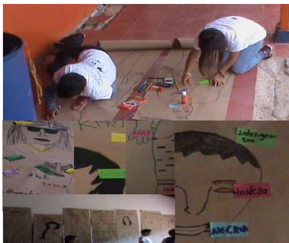
Fotografía 10. Mi cuerpo que emociona.

Más adelante completamos la cartografía con las emociones como clave de representación. Emociones como la alegría, la tristeza, el desagrado, el miedo, la furia, el amor, la vergüenza son formas adaptativas y motivacionales de su cuerpo y, como tal, resultan clave en la elaboración de los juicios sobre lo bueno y lo malo, por lo que tramitarlas y reelaborarlas cumple un papel esencial. “Cuando tengo rabia deseo que nadie me hable, me dan ganas de pelear y en el cuerpo me hierve la sangre, me siento caliente, furioso, impotente, malgeniado, gruñón, desesperado, con ganas de acabar con todo”. “Con miedo no soy capaz de nada, me lleno de temor a empeorar las cosas, me siento frágil y cobarde, siento inseguridad, no quiero estar solo, me vuelvo paranoico y me asusto”. (Taller sobre cuerpo y emociones)