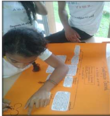
Fotografía 6. Aprender a leer el mundo.

Vinieron entonces las entrevistas a padres, abuelos, hermanos y vecinos, tratando de recopilar la mayor cantidad de historias sobre el municipio, su antes y su ahora. Y entre las historias de pájaros y chusmas 2 , azules y rojos, ausencia estatal, convites, bailes, ilusiones de vidas mejores, auge eco-