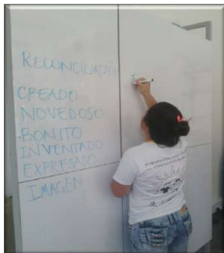
Fotografía 13. Repensando la reconciliación.

El bien refiere del mismo modo al cuidado y reconocimiento del otro, de su dolor y de la potencia colaborativa que ayuda a transformarlo. La solidaridad es escuchar, hablar ponerse en lugar del otro, tratar de sentir lo que el otro siente y en esa medida actuar; es: “Buscar lo que nos sirva a todos, a los de aquí, a los de las veredas, a los de Aquitania, a los comerciantes, a los campesinos, a los abuelos, a los niños a nosotros o sea a todos los de San Pacho” (Taller sobre emociones políticas).