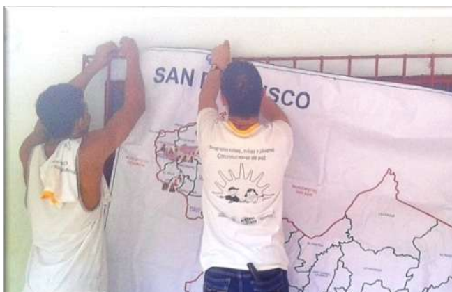
Fotografía 8. Aquí existimos.

El horror de la guerra, la segregación territorial, el confinamiento cultural, las dinámicas de un medio natural, social y político en permanente disputa y los proyectos de vida individuales en oposición a las perspectivas colectivas; son las realidades desde las cuales los/las jóvenes experimentan el mundo. De acuerdo con los relatos que dan vida a la línea de tiempo y la cartografía social, la construcción de la historia de la violencia política y estructural de San Francisco surgió en el marco de una sociedad católica y conservadora, en medio de procesos de desarrollo de la economía nacional acelerados y bajo el influjo del frente Carlos Alirio Buitrago del ELN, del 9° frente de las FARC, de las Autodefensas Campesinas del Magdalena Medio (ACMM) y las Fuerzas Armadas del Estado.