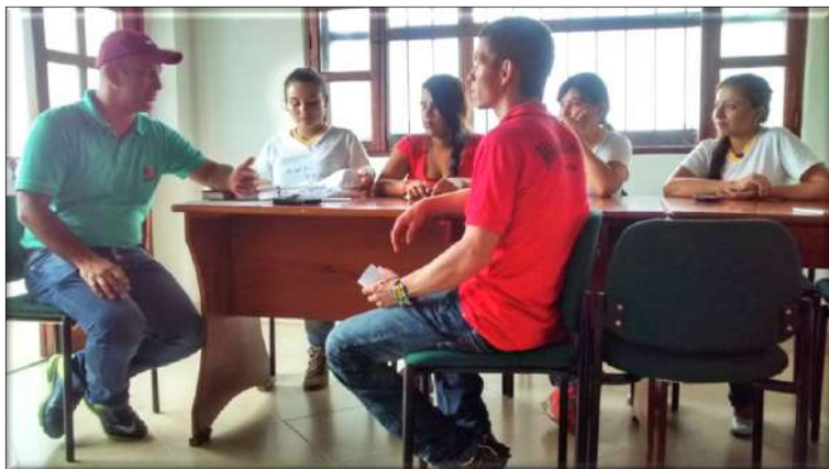
Fotografía 14. Somos interlocutores válidos. Encuentro con el alcalde para gestionar la acción en La vereda La Esperanza.

municipio; comprometiéndolos con el apoyo de recursos económicos, alimentación, espacio físico y materiales de trabajo para el desarrollo de la actividades programadas (el proyecto hizo aportes en materiales de trabajo); y por último, la comisión logística realizó la ambientación del espacio y dispuso de todos los materiales y recursos requeridos y de la animación de la jornada.