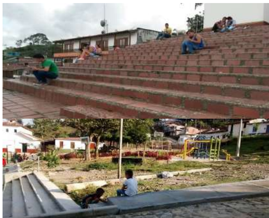
Fotografía 1. El espacio en el Corregimiento de Aquitania.

Los primeros ejercicios estuvieron dirigidos a reconocer su existencia en espacios concretos, propiciando la reflexión de los chicos y chicas sobre su realidad social, cultural y política. En esta vía, se promovieron recorridos de observación por el parque principal y sus calles circundantes, con la idea de estimular vínculos con la realidad observada y sus tramas de sentidos y significados.