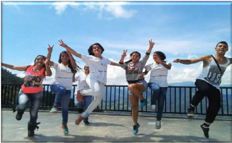
Fotografía 17. Somos constructores y constructoras de paz.

Toda nueva acción, todo nuevo comienzo, como el que planteó esta propuesta de investigación formativa, parte de entramados simbólicos ya existentes, y, sin embargo, da lugar a nuevos contenidos y sentidos; para aprehender algo, uno debe haber pensado por sí mismo, por su propio desdramatamiento. El conflicto armado y las violencias políticas, estructurales y personales han tocado la vida de este grupo de jóvenes; el proceso de comprensión de lo que ha acaecido ha demandado un proceso de autocomprensión de su presencia en el mundo y de la manera en que lo han habitado. Las diversas manifestaciones de su existencia, sus experiencias de vida, las tramas de sentidos y significados en los que están inmersos, su pasado y sus visiones del presente y del futuro son sometidos a procesos de resignificación propios de la comprensión, y esta, partiendo del mundo propio, traspasa sus límites, para instalarse en un mundo con otros y otras. Esto es lo que ha acontecido en la subjetividad de los/as jóvenes. La expresión “ya no somos los mismos”, así nos lo revela. Su participación en esta experiencia introdujo algo nuevo y creativo en sus vidas, y tenemos la esperanza que sus trayectorias de vida así lo revelen. Ideas como estas sustentan la importancia de modelos como el de la Etno-