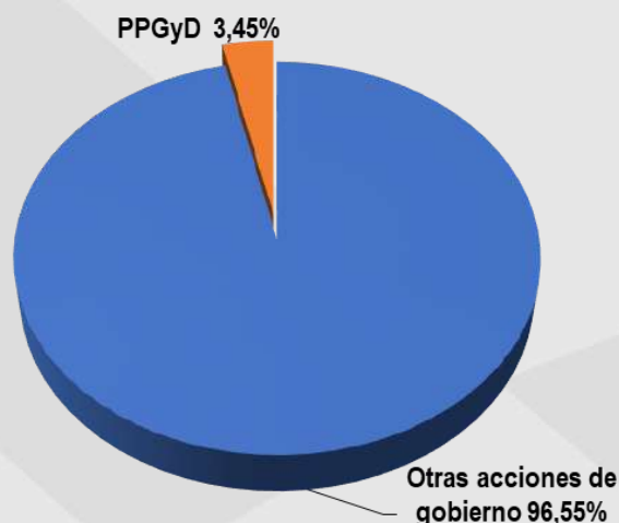
Gráfico 1. Representación del Crédito etiquetado PPGyD en el Presupuesto Público Provincial 2022 8

Además, el Gobierno de la provincia de La Rioja presentó por primera vez para el ejercicio 2022 un presupuesto donde se identifican y etiquetan programas en función a los Objetivo de Desarrollo Sostenibles (ODS), en los que cada acción se alinea con un objetivo de la Agenda 2030 adoptada por Argentina, destacándose la incidencia del ODS número 5 - Igualdad de Género y Empoderamiento de la Mujer.