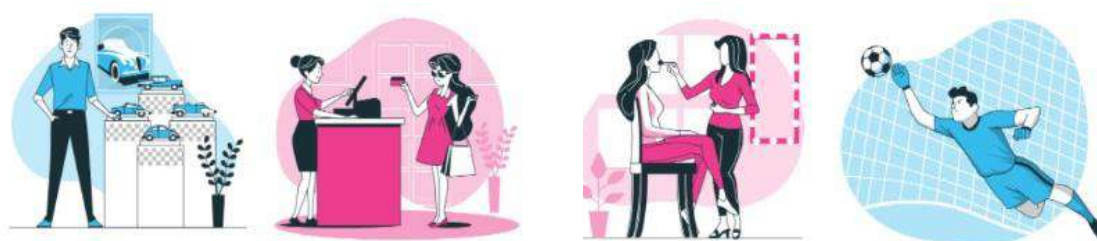
Figura 2: Representación de gráfica de roles y estereotipos de género