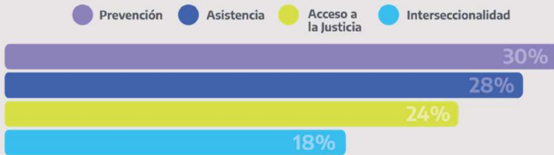
Gráfico 2: Distribución porcentual de la participación por comisión