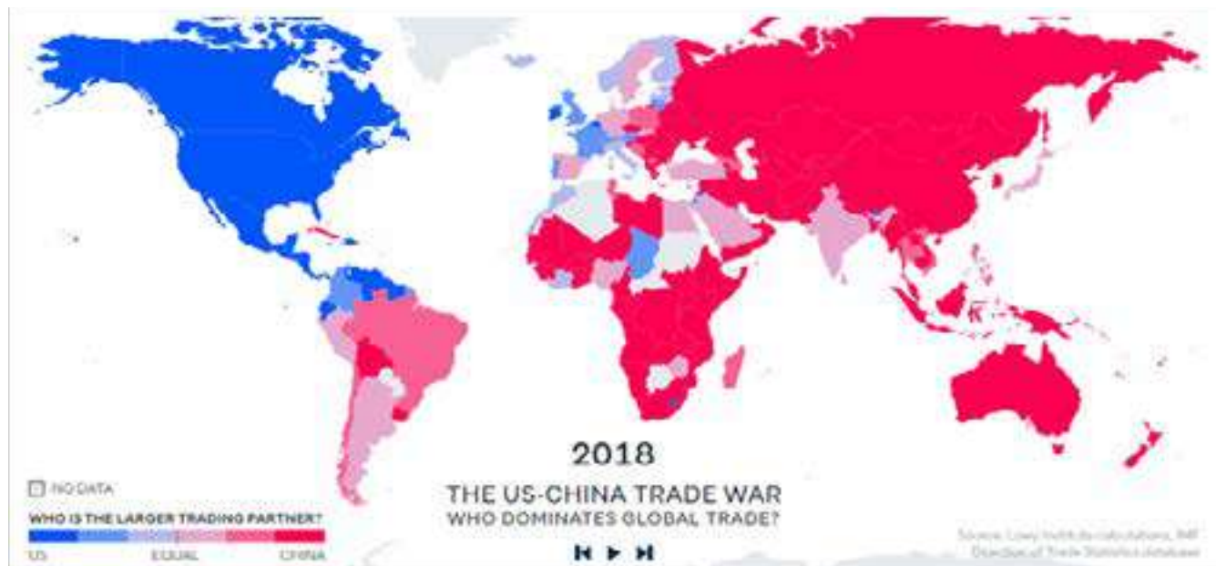
Fig. No. 1: Guerra comercial entre Estados Unidos y China.