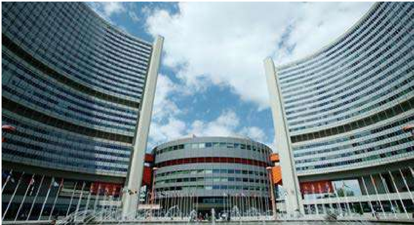
Fig. No. 2. Sede del Organismo Internacional de Energía Atómica (OIEA) en Viena, Austria.