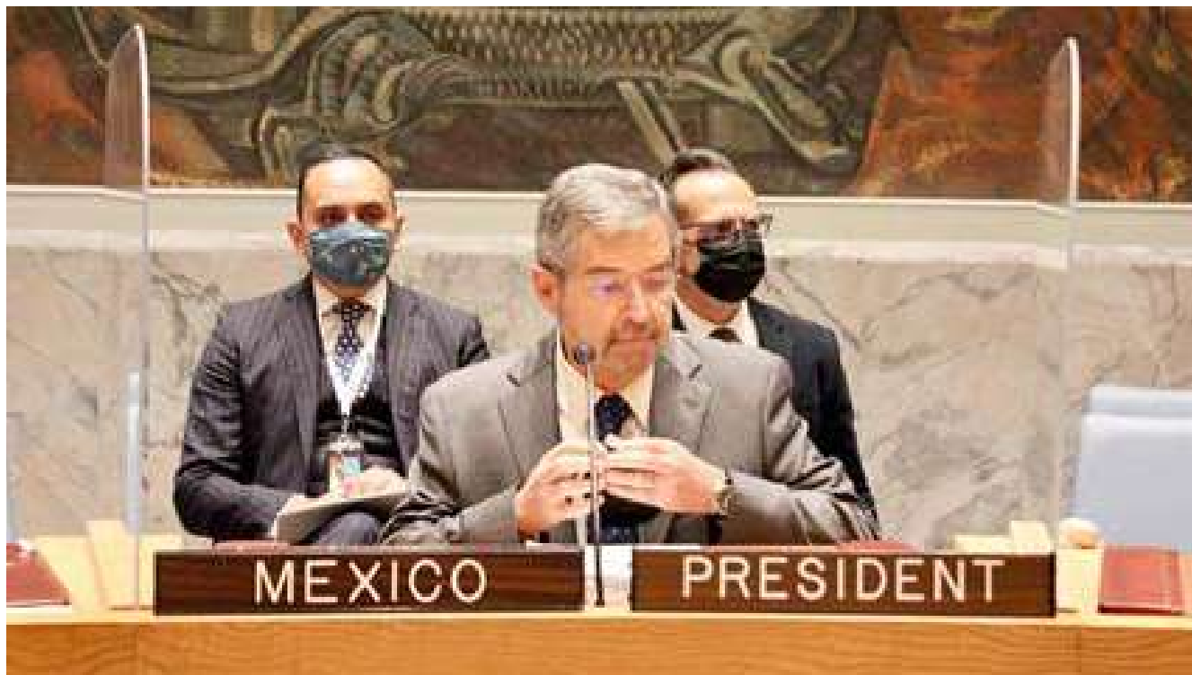
Fig. No. 1. Embajador mexicano ante el Consejo de Seguridad de las Naciones Unidas en 2021, Juan Ramón de la Fuente (ex-rector de la UNAM).