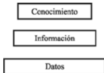
■ Fig. 1. Pirámide informacional.

Se utilizará el Sistema Internacional de Unidades.