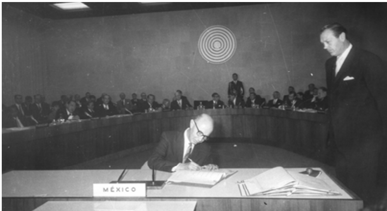
Fig. No. 3. Embajador Emérito Alfonso García Robles durante la firma del Tratado de Tlatelolco.

Como parte de las labores de la Comisión, se establecieron tres Grupos de Trabajo, que debían atender los siguientes tópicos: la definición de los límites geográficos de la ZLAN, la promoción de la colaboración regional, la incorporación de los Estados latinoamericanos que aún no eran parte de COPREDAL y la responsabilidad de otros Estados cuyos territorios pudiesen quedar comprometidos dentro de la zona (Grupo A); el estudio de los métodos de verificación, inspección y control para garantizar el cumplimiento de las obligaciones derivadas del futuro Tratado (Grupo B) 10 ; y la obtención del compromiso de respetar, estrictamente, el estatuto jurídico de la desnuclearización de la América Latina, por parte de las potencias nucleares (Grupo C) 11 .