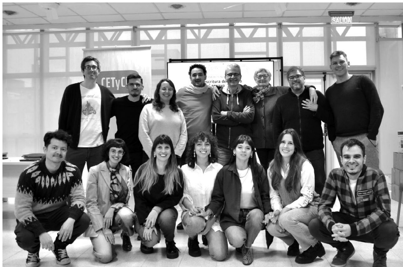
Foto final de las jornadas de ensayo