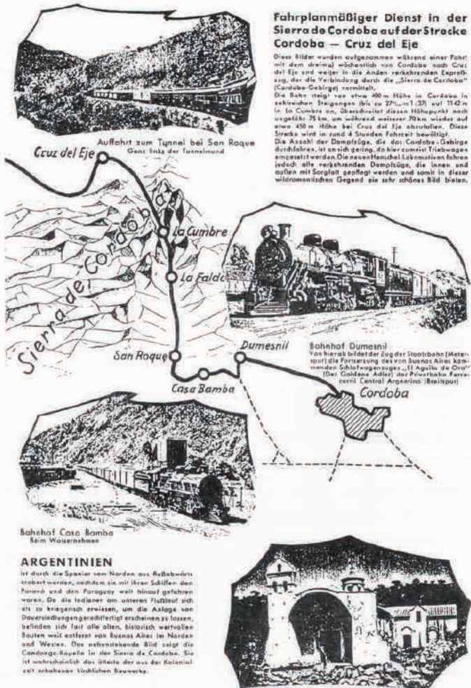
Imagen 1. Recorrido del tendido del Ferrocarril Córdoba y Noroeste (FCCo y No) en un folleto de 1938 (revista publicitaria de la empresa alemana Henschel, que construyó ramales en la Argentina)

sus líneas las zonas de planicie, por lo que prácticamente se obvió a la región, a diferencia de la zona centro y sur de la provincia.