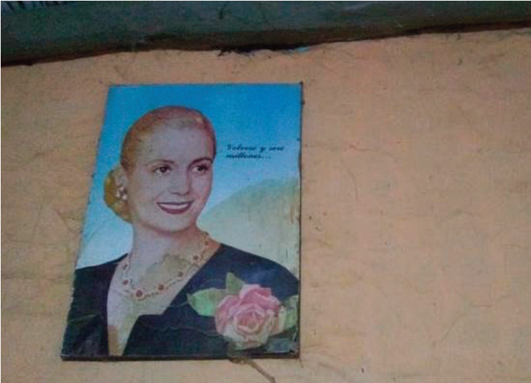
Imagen 3. Cuadro de Eva Perón en una casa en la localidad de Chancaní, noroeste de Córdoba

en el control de las poblaciones en donde las enfermedades endémicas fueras más acuciantes. En ese marco, en la zona del noroeste cordobés, enfermedades como el paludismo, la brucelosis y el Chagas 20 comenzaron a instalarse como problema sanitario de importancia.