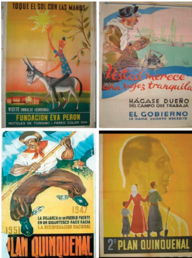
Imagen 2: Publicidades oficiales durante los dos primeros períodos de gobierno peronista

peronistas-cabecitas negras-migrantes internos [eran asociados] con las ideas de incivilidad, agresividad, vulgaridad e ignorancia como forma de enfrentar la amenaza que significaba el encuentro con los ‘sectores populares’ que habían invadido no solo el espacio público sino además el espacio simbólico (Milanesio, 2010, en Rosa, 2011: 12).