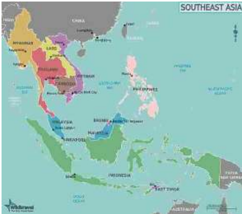
MAPA 1. SUDESTE ASIÁTICO 17

Por tanto, los países que integran al Sudeste Asiático son, Brunei, Camboya, Indonesia, Laos, Malasia, Myanmar, Filipinas, Singapur, Tailandia, Timor Oriental y Vietnam (Molina y Regalado, 2014; Vega y Hernández, 2015). Enseguida un mapa para mejor ubicación geográfica de la subregión.