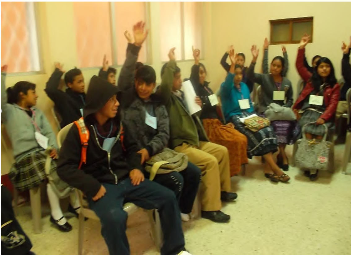
Taller con jóvenes que responden a la pregunta: ¿Quiénes tienen un familiar cercano en Estados Unidos? Momostenango, Totonicapán, Guatemala, 2013.

como una estrategia campesina e indígena de sobrevivencia (Corona y Reyes, 2009). Esta práctica, permitió enfrentar los embates de la represión política ocurrida en Guatemala en el contexto del conflicto armado interno, intensificado en la década de los ´ 80, lo que propició una importante intensificación del desplazamiento interno y del cruce de fronteras entre países para salvaguardar la vida de grandes contingentes de población, solicitantes de refugio y asilo.