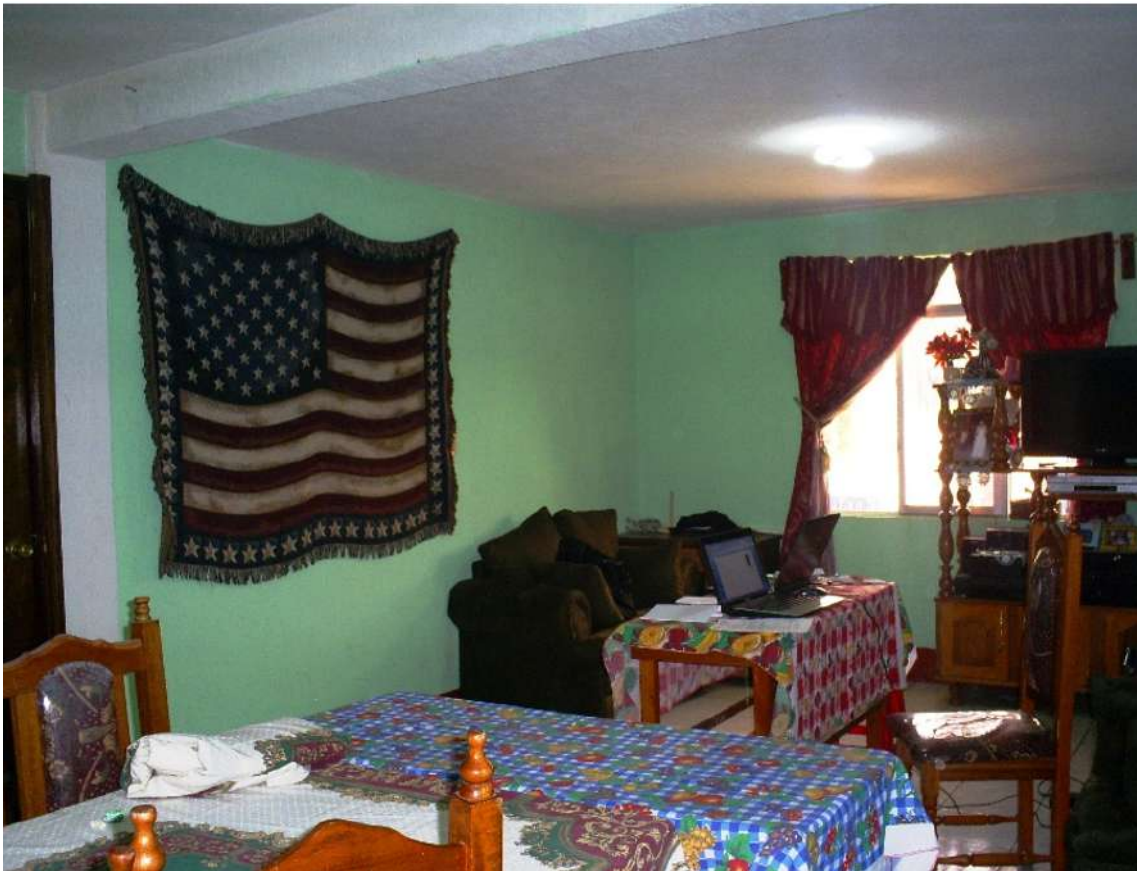
Foto: Natalia Ortiz Barrientos, Aldea Los Duraznales, Concepción Chiquirichapa, Quetzaltenango, 2010.

utilizan mecanismos de arrastre para la reunificación familiar y de ocupación de territorios en el destino con vecinos y familiares.