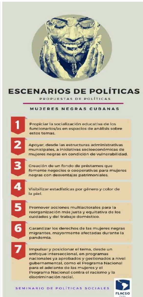
Infografía de las tendencias de desigualdades en las mujeres negras y propuestas de políticas.

Estos seminarios se caracterizaron por la participación multiactoral -ministerios, organizaciones sociales, asociaciones profesionales, comisiones de trabajo, grupos asesores, instituciones académicas, técnicas y organizaciones no gubernamentales-, el diálogo interdisciplinar y transdisciplinar , y en particular de las mujeres negras, rurales o migrantes de