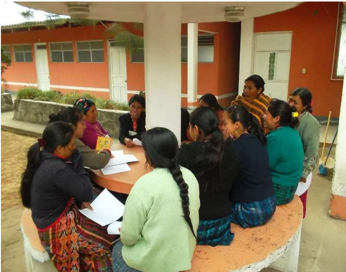
Taller con comadronas que discuten sobre migración, Salcajá, Quetzaltenango Guatemala, 2016.

internacional y como práctica institucional reconocida, modifican sus enfoques, metodologías y beneficiarios con el cambio de gobierno cada cuatro años, además de que con frecuencia son utilizadas con propósitos clientelares en el contexto de los procesos electorales.