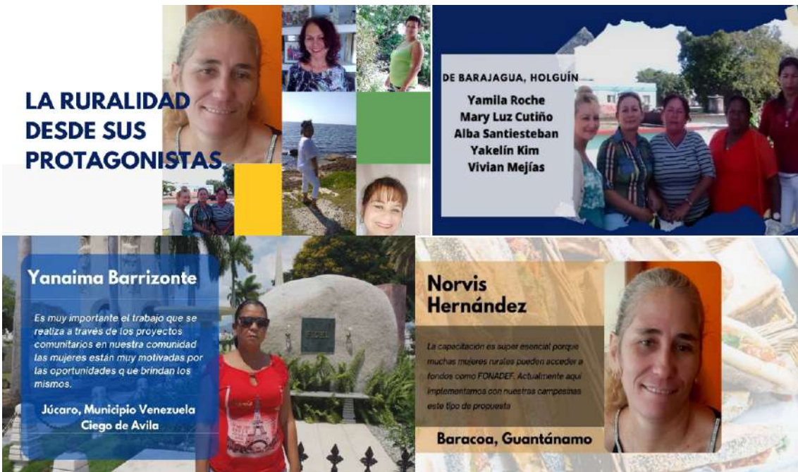
Memoria fotográfica de algunas de las participantes en el foro virtual con mujeres rurales