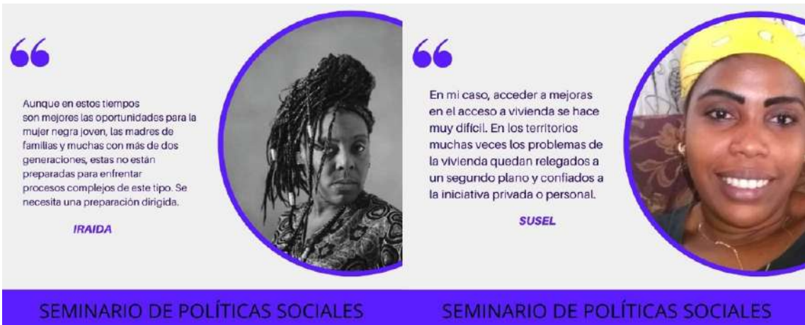
Memoria fotográfica de algunas de las participantes en el foro virtual con mujeres negras