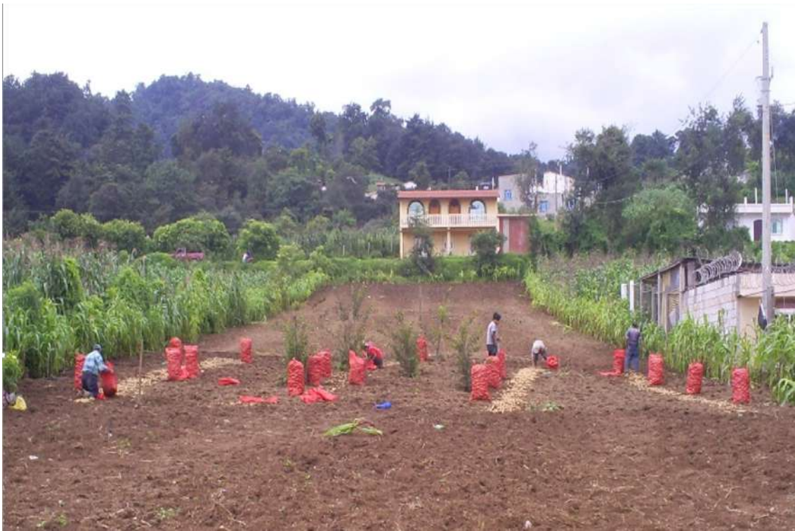
Cultivo de papa, Aldea Los Duraznales, Concepción Chiquirichapa, Quetzaltenango, 2010.

movilización del trabajo con esquemas de explotación del pago en especie, tiendas de raya, pago por tarea y hasta alimentos por trabajo.