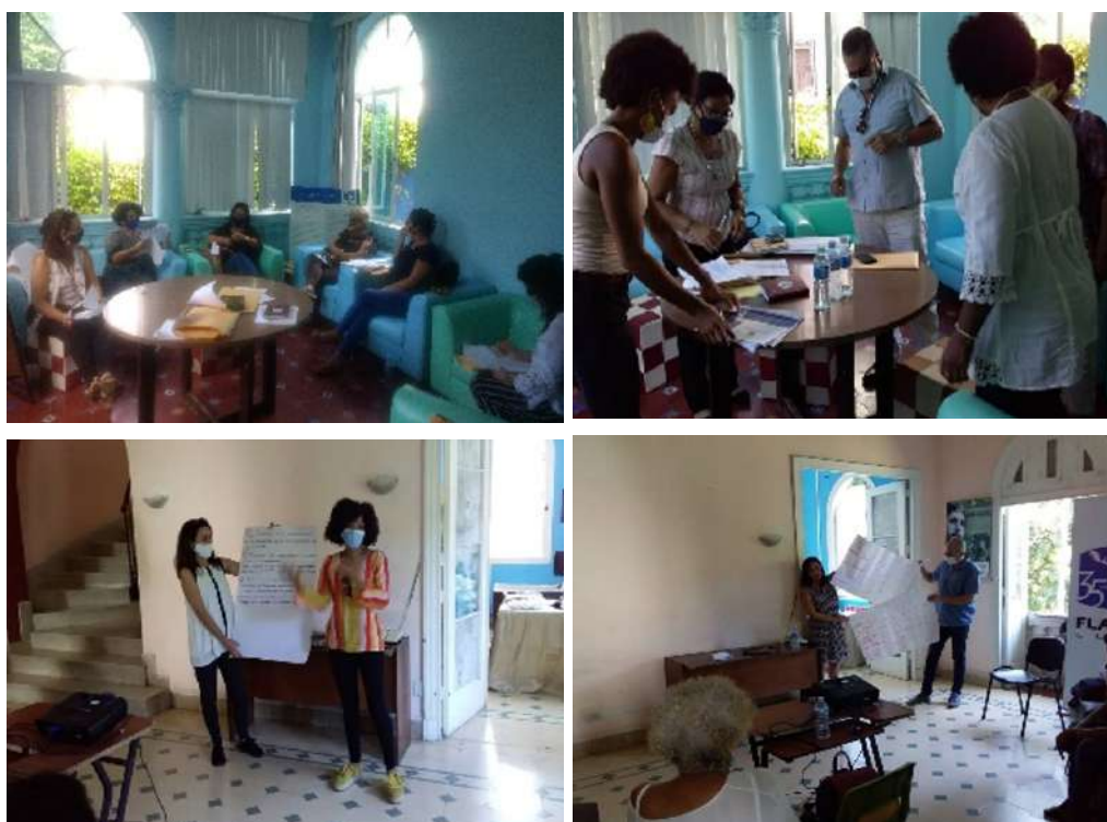
Memoria fotográfica de los seminarios sobre las situaciones de vulnerabilidad en mujeres rurales (30 octubre 2020) y mujeres negras (20 noviembre 2020)

Los dos primeros seminarios –sobre mujeres rurales y mujeres negras– permitieron constituir grupos de trabajo virtual con especialistas, para la consulta acerca de los efectos de las políticas públicas en estas poblaciones mediante análisis prospectivo, y sobre propuestas de políticas públicas, en el marco de la actualización de la estrategia económica y social de Cuba en el enfrentamiento a la COVID 19.