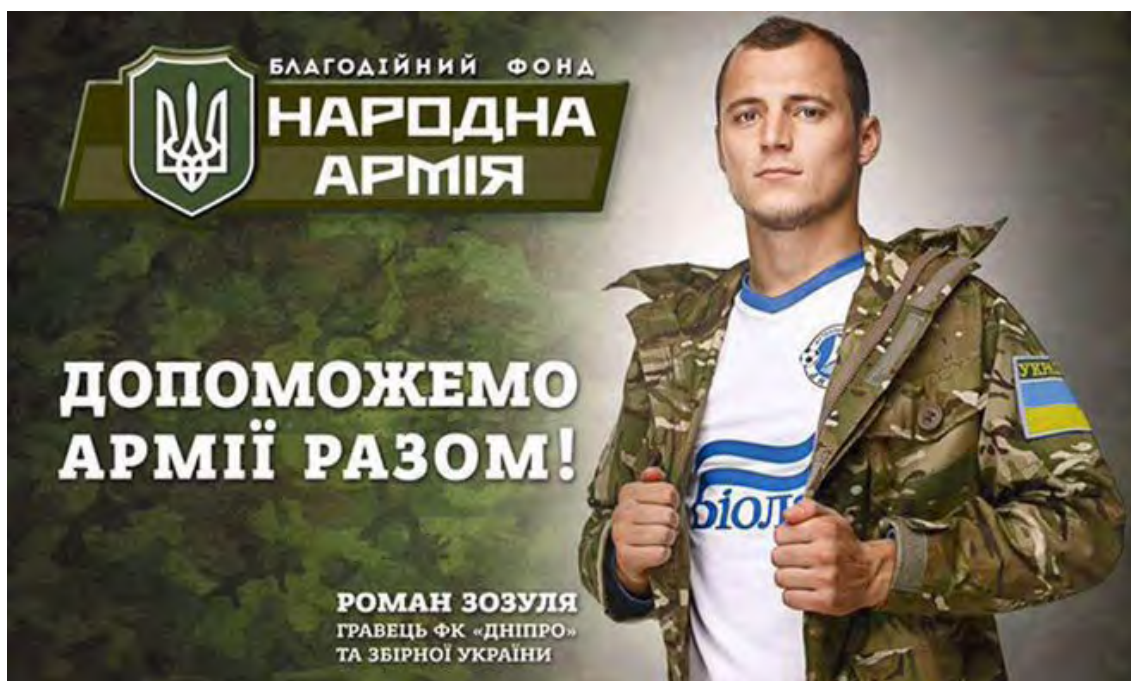
Cartel oficial del "Ejército de la patria", una de las organizaciones compuestas por barristas y futbolistas ucranianos. Tomada del Twitter del periodista español Daniel J. Ollero (@DanielJollero).