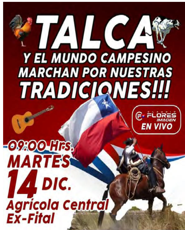
Afiche N° 2 a favor del rodeo.

Un caso poco estudiado y muy representativo es el rodeo en Sudáfrica, donde luego del Apartheid los afrikáner 5 necesitaban un espacio donde