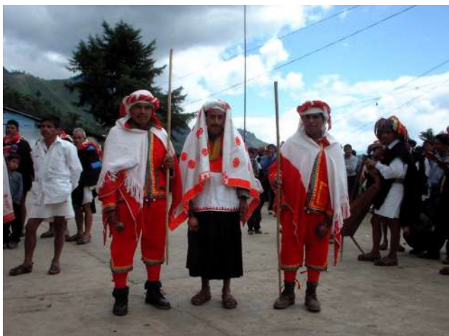
Me'Tsakel , la Madre de la Montaña, con sus dos acompañantxs inseparablxs, tríada nombrada: “los perseguidxs”, lxs paxionxs ”, los “sacrificadxs del pasado”. Polhó, 2009.