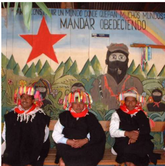
Las autoridades autónomas: presidente, síndico y secretario al frente del Consejo Autónomo de Gobierno, Polhó 2009.