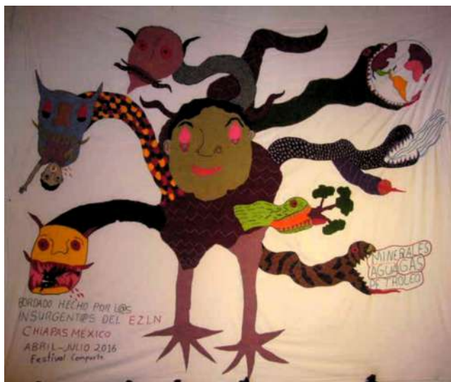
La Hidra , manta bordada por lxs insurgentxs del EZLN para el CompArte, 2016.