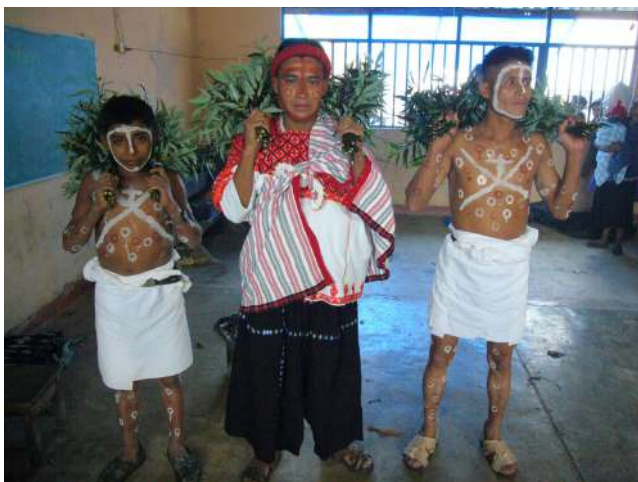
Me' Kabinal , la Madre de la Selva, y los dos “cruzados”, también llamados los dos jaguares o los soldados de la Virgen. Polhó, 2007.

la población indígena que antes no existieron (Aubry 2004, González 2002).