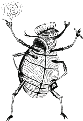
Don Durito , diseño para la colección Lecturas urgentes de Barullo Casa Taller, Cali, Colombia, 2019. Ilustración: Sebastián Giraldo.