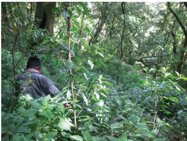
Compañero zapatista en las caminatas por la Reserva Autónoma Zapatista El Huitepec, 2010.