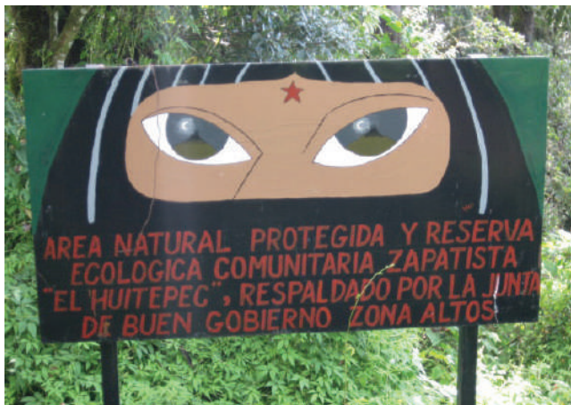
Letrero al ingreso de la Reserva Comunitaria Zapatista, Huitepec, San Cristóbal de Las Casas, Chiapas, 2010.