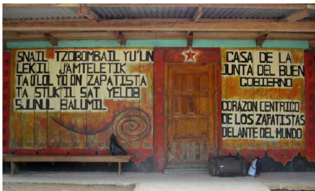
Caminar preguntando: maletas esperando fuera de la oficina de la Junta de Buen Gobierno de Oventik, Chiapas, 2009.