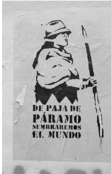
Imagen 1. Esténcil alusivo a Dolores Cacuango. Marcha del 8 de marzo de 2020 en Quito, Ecuador