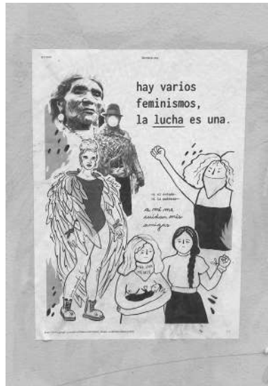
Imagen 2. Afiche alusivo a Dolores Cacuango. Marcha del 8 de marzo de 2020 en Quito, Ecuador