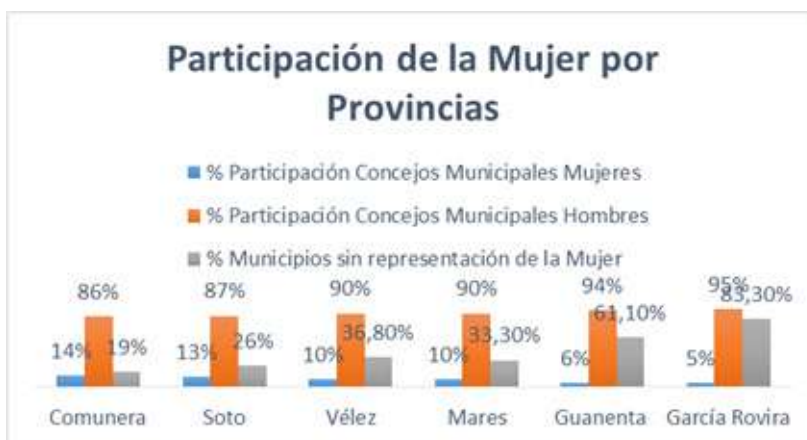
Gráfico 2. Participación de la mujer por provincias.

En la contienda electoral del período 2008-2011, a nivel de municipios, las mujeres alcanzaron representación en el 9.1%, en las alcaldías de 8 municipios. Mientras que en los Concejos Municipales lograron 82 curules de un total de 820. Lo que equivale al 10%, evidenciando un leve incremento en comparación con las elecciones anteriores. El panorama por provincias respecto de la participación de la mujer en los Concejos Municipales permite evidenciar que el porcentaje más alto se encuentra en un 14%, correspondiente a la provincia Comunera. Así mismo dos provincias se encuentran por debajo del 10%, como son la provincia de Guantán con el 6%, y, García Rovira con el 5%.