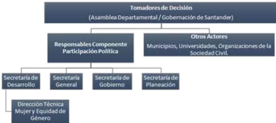
Gráfico 3. Estructura de funcionamiento.

El Componente de Participación Política y Representación para la Autonomía de la Mujer de la PPMEG se compone de 13 acciones, las cuales se pueden clasificar en cinco subgrupos, siendo estos: (i) Formación / Educativa, (ii) Liderazgo y emprendimiento, (iii) Investigación, (iv) Institucionales y (v) Promoción. Desde el diseño de la Política se asignaron responsables y actores en los diferentes objetivos y acciones planteadas. También, en ese sentido, se plantea como estructura de operación del mencionado componente, la siguiente: