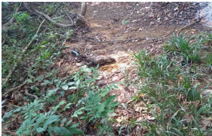
Iguana, fauna típica del sitio.

Por todo lo anterior, el Arroyo de San Basilio de Palenque es de una gran importancia para la comunidad, pues representa el centro de vida en la que se logra manifestar la cotidianidad cultural de los habitantes de este pueblo, ya sea como espacio recreativo, como comunicativo, de consulta y hasta de solución de conflictos.