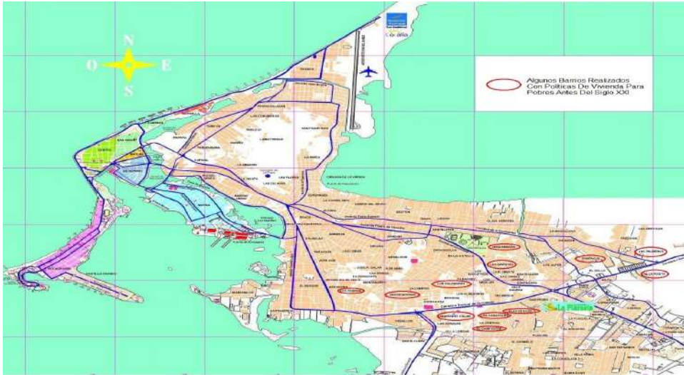
Mapa 1 Ubicación geográfica VIS en Cartagena