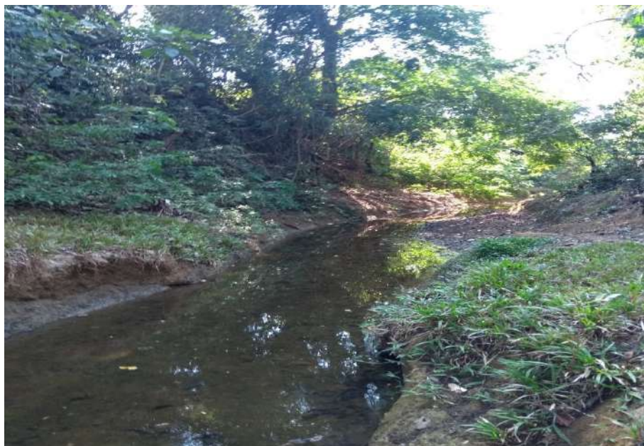
Arroyo de Palenque en el sector Alberto.

Asimismo, el Arroyo era un lugar que se destacaba porque representaba el sitio en el que se encontraban muchas personas para recolectar un poco de agua para bañarse o para lavar la ropa. Esta última labor era desarrollada por las mujeres de la comunidad, quienes se ubicaban por orden de llegada una tras la otra en la corriente de agua, tratando siempre de llegar temprano para ubicarse en el primer puesto, y así no recibir el agua usada de la ropa de las demás. En un día podían ir a reunirse cerca de 15 mujeres en el Arroyo.