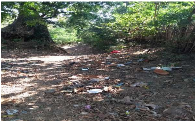
Entrada al Arroyo en el sector Caballito.

El daño, como lo indica Henao (1998) es la aminoración patrimonial –material e inmaterial– sufrida por la víctima, que puede ser tanto individual por la vulneración de los derechos subjetivos, así como respecto a los derechos colectivos. En materia ambiental es la afectación negativa relevante del ecosistema, los recursos naturales o el ambiente (Cafferatta, 2009) o como lo define el artículo 42 de la Ley 99 de 1993, la afectación del normal funcionamiento de los ecosistemas o de la renovabilidad de sus recursos y componentes.