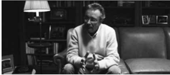
Fuente: Sigman, H., Almodovar, P. et al. (productores). Szifrón, D. (director) (2014). Relatos salvajes . Argentina. Kramer & Sigman Films.