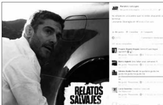
Fuente: Sigman, H., Almodovar, P. et al. (productores). Szifrón, D. (director) (2014). Relatos salvajes . Argentina. Kramer & Sigman Films.

De esta manera se acercaban al público de una manera diferente a la usual, ya que los usuarios de la red social respondían a los posteos.