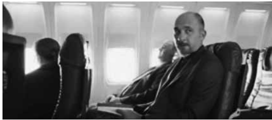
Fuente: Sigman, H., Almodovar, P. et al. (productores). Szifrón, D. (director) (2014). Relatos salvajes . Argentina. Kramer & Sigman Films.