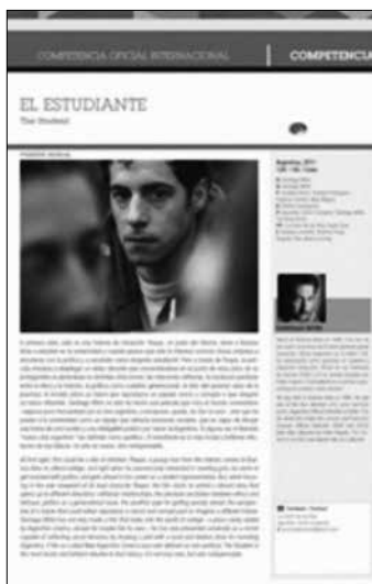
Fuente: El Estudiante , director Santiago Mitre, 2011. Catálogo BAFICI 2011 en http://estivalesanteriores.buenosaires.gov.ar/bafici/home11/web/es/index.html . Acceso 16 febrero de 2016.