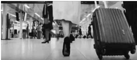
Fuente: Sigman, H., Almodovar, P. et al. (productores). Szifrón, D. (director) (2014). Relatos salvajes . Argentina. Kramer & Sigman Films.