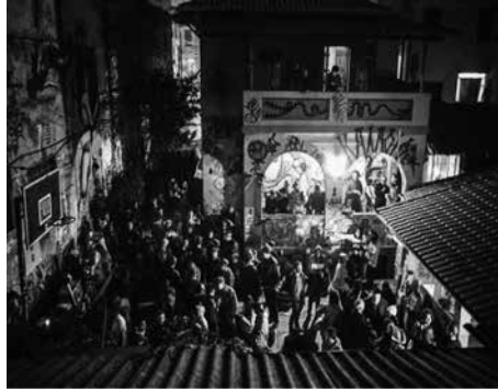
Media Ninja (2014). Casa Colectiva San Pablo. [Fotografía].