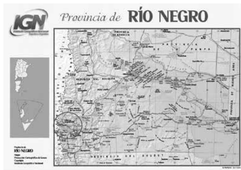
Mapa de la provincia de Río Negro (a la izquierda, situación relativa en la Argentina). Al oeste puede apreciarse la ciudad de San Carlos de Bariloche, y en gris la jurisdicción del Parque Nacional Nahuel Huapi. Fuente: Instituto Geográfico Nacional, 2014.