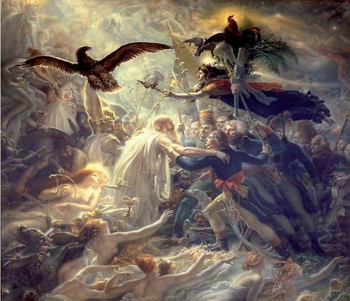
Apothéose des héros français morts pour la patrie pendant la guerre de la liberté. Anne Louis Girodet, 1802.

En 1802, Anne Louis Girodet -discípulo de David- dio vida a la maravillosa obra “Apothéose des héros français morts pour la patrie pendant la guerre de la liberté”, pintura inspirada en los poemas gaélicos de Ossian publicados en 1760 por James Macpherson.