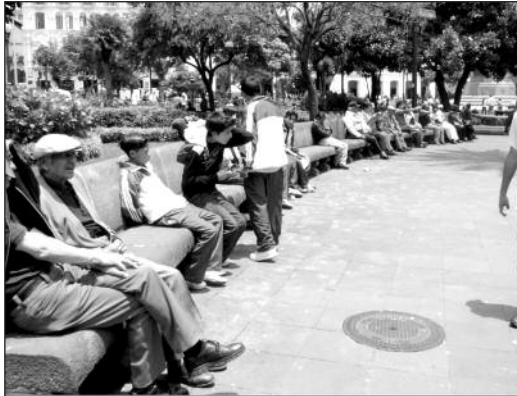
Fotografía 1 Silla de hormigón. Disposición en hilera (Plaza Grande)

Las sillas de la plaza acogen a casi trescientas personas. Existen cuatro estancias para veintiún personas, además de caminerías iluminadas dotadas de basureros y protegidas de la circulación vehicular con mojonos. Las sillas tienen dimensiones ergonómicamente adecuadas en medidas para adultos, aunque están hechas con materiales duros. Están medianamente protegidas del sol y podría decirse que prestan una confortabilidad mediana a sus ocupantes. Es necesario hacer notar que las condiciones de mobiliario se estudian desde la ergonomía para medir/controlar los tiempos de estancia según los requerimientos de los distintos ambientes arquitectónicos. Las sillas se disponen generalmente en hilera, respetando y/o propiciando el individualismo de sus ocupantes. Las cuatro estancias que posibilitan la comunicación grupal casi se desintegran por presencia de una pila central, volviendo entonces a la hilera.