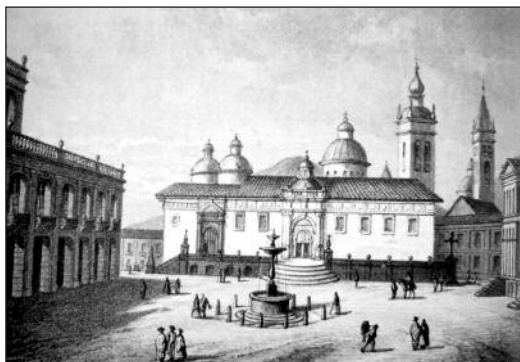
Fotografías 5 Imagen de la Plaza Grande 1853

El ajardinamiento de la plaza –realizado por García Moreno– se mantiene y se cuida. La razón quizá sea que cumple funciones más importantes que las puramente simbióticas, pues, además de la forma, la fragilidad de sus componentes delimitan con facilidad la formación de protestas.