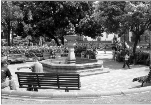
Fotografía 8 Imagen de la Plaza Grande 2010