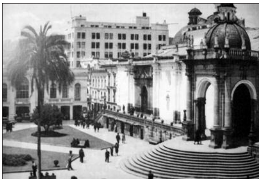
Fotografía 6 Imagen de la Plaza Grande