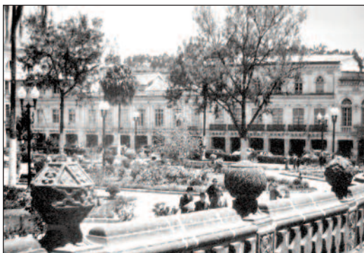
Fotografía 7 Imagen de la Plaza Grande 1952