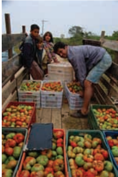
Brasil. Assentamento Ipanema.