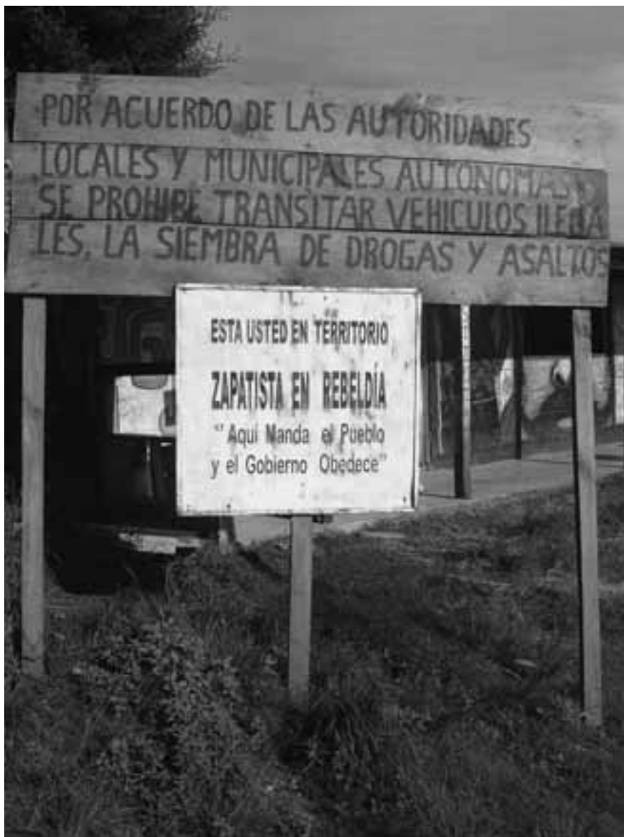
México, Chiapas, Oventik. Autora: Luciana García Guerreiro