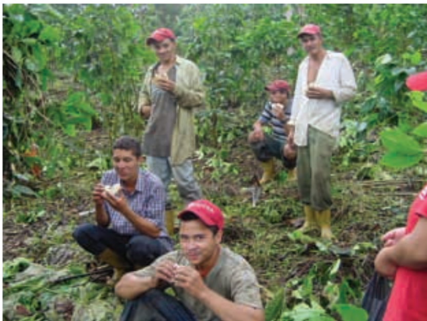
Venezuela, Chavasquen.