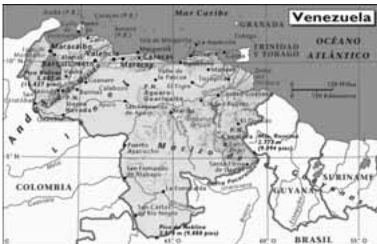
Mapa de Venezuela