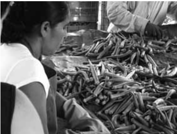
Guatemala. Autor: Bernardo Fernandes Mancano