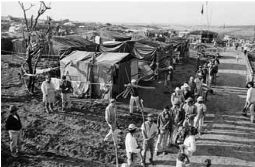
Brasil - Acampamento de Ipero II. Autor: Douglas Mansur).jpg