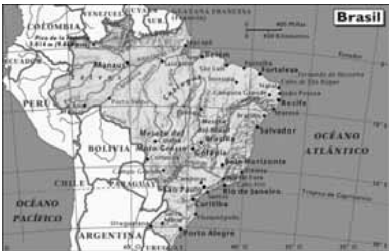
Mapa de Brasil