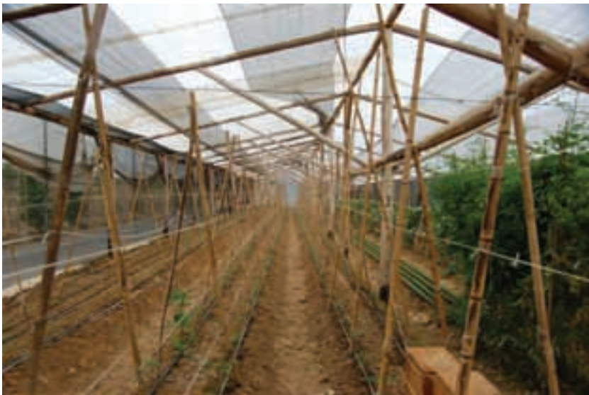
Brasil. Assentamento Ipanema.