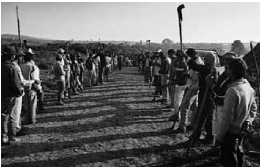
Brasil - Acampamento de Ipero. Autor: Douglas Mansur

BMF: Aquí yo puedo ofrecer una información. Nosotros acabamos de terminar una investigación basada en datos, pasados en confianza, de la Auditoría Agraria Nacional (AAN) y de la Comisión Pastoral de la Tierra (CPT). La CPT y la AAN siempre han registrado las ocupaciones y los asentamientos, y siempre hay una disputa de números en cuanto a la cantidad de asentamientos que hubo. Yo pedí los datos de ocupación por ocupación y los crucé uno por uno. El 40% de los datos registrados por la AAN, la CPT no los tenía registrados. Y el 40% de los datos de la CPT, la AAN, no los había registrado. Coincidían, más o menos, en la mitad. El resto, cada uno tenía un dato que el otro no había conseguido. Cuando se confrontaba todo, yo tomé los datos de ambas organizaciones para el período 1995 /2005, la CPT registró 600.000 familias ocupando tierras y la AAN registró que hubo 480.000 familias ocupando tierras. Cuando se confrontan los datos, se llega a la cifra de que 900.000 familias ocuparon tierras en esos 10 años. Todos los estudios se hicieron siempre con datos parciales nunca con datos completos. Y con respecto a los asentamientos, el gobierno de Lula tiene una característica interesante, diferente al gobierno FHC. El gobierno de FHC desapropió mucho más que Lula, sólo que con Lula, si bien el número de familias asentadas es menor, el área es casi el doble.