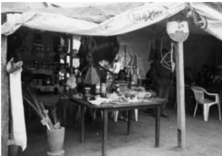
Argentina. Feria Mailin. MOCASE. Autor: FANA