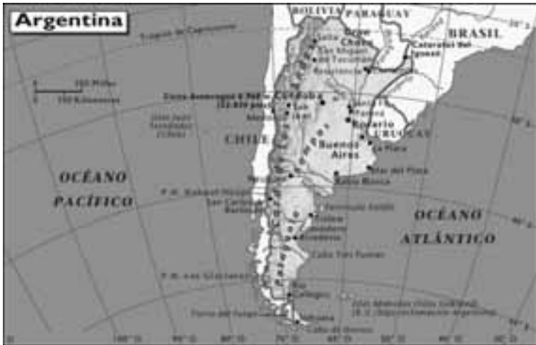
Mapa de Argentina