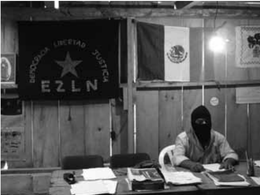
México, Chiapas, Oventik. Autora: Luciana García Guerreiro

sino lo que nos da la tierra y mi gusto es eso, estar con el movimiento, luchar por mis compañeros y darles de comer, eso es mi emoción. Porque siempre vamos a defender la tierra y defender al pueblo. Y, a base de tanta constancia, yo les enseñaba a otros compañeros a decir consignas, a que gritaran y ahí ya la gente se fue enseñando a gritar, a decir las consignas, a no dejarse y ahí aprendí yo. Yo aprendí mucho, mucho del movimiento. Incluso aprendí a defenderme de mi propio esposo, aprendí a defenderme del gobierno, aprendí a no tenerle miedo al gobierno, aprendí a defenderme por sí sola y ayudarle también a la gente a que se defendiera, porque ya no nos íbamos a quedar callados. Anteriormente éramos sumisas, éramos hasta maltratadas por los hombres; ahora ya no, ya no maltratamos, yo aprendí mucho. Le debo mucho al movimiento porque aprendí muchas cosas, que la mujer valemos tanto o más que el otro. Hasta aprendimos a hablar, porque no sabíamos hablar, nos daba pena hablar, nos daba pena decir algo, ya no. Aprendimos a defendernos. Ahora, no nomás, hablamos, gritamos y la lucha sigue. . .