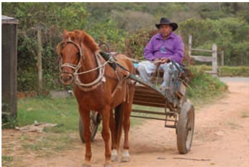
Brasil. Assentamento Ipanema.