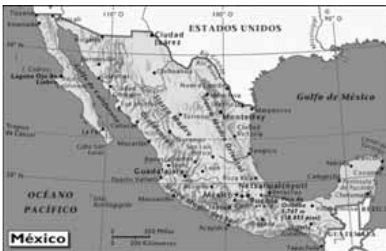
Mapa de Mexico