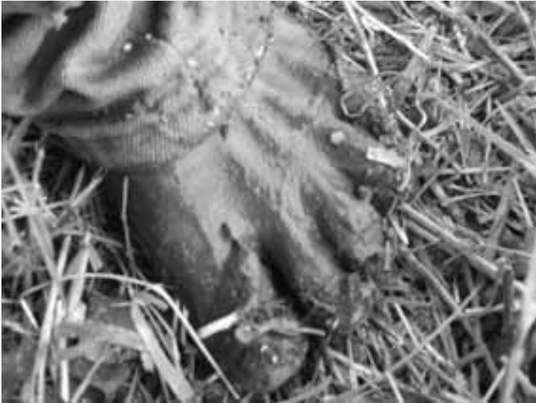
Guatemala. Autor: Bernardo Fernandes Mancano