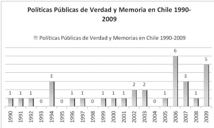
Gráfico N° 10: Políticas Públicas de Verdad y Memoria por año en Chile 1990-2009 Fuente: Fichas del Estudio