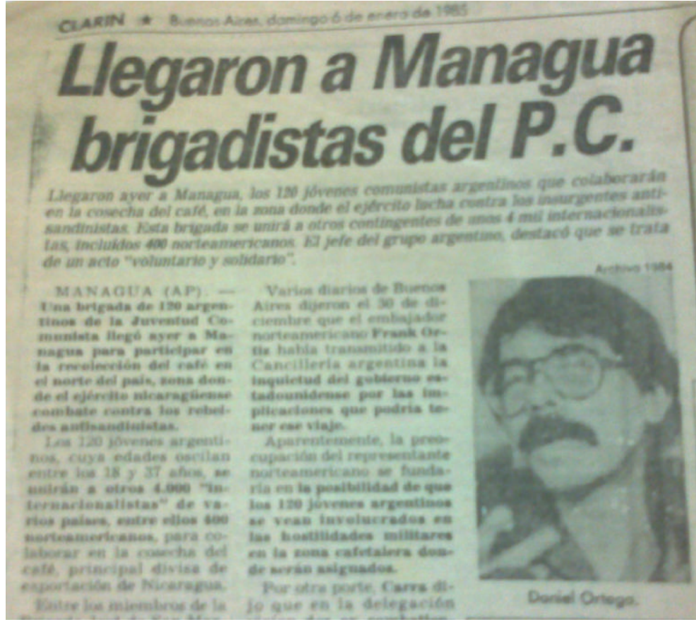
Diario Clarín. 6 de enero de 1985.

El trabajo en curso no es exclusivamente de historia oral, por ello, además de haber realizado 15 entrevistas desde el comienzo de la investigación, hemos relevado la prensa del PCA y de La Fede de los años 1984, 1985 y 1986, además del diario La Capital de los mismos años. Hemos incorporado como sostén de las entrevistas y como fuentes para el análisis una gran cantidad de fotografías y un audiovisual de la época que son puestos en tensión con otros documentos: los producidos en el seno de la dirección partidaria. Entre estos últimos, se hallan los informes del Comité Central y sus resoluciones.