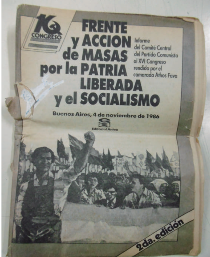
Informe del Comité Central, 1986.