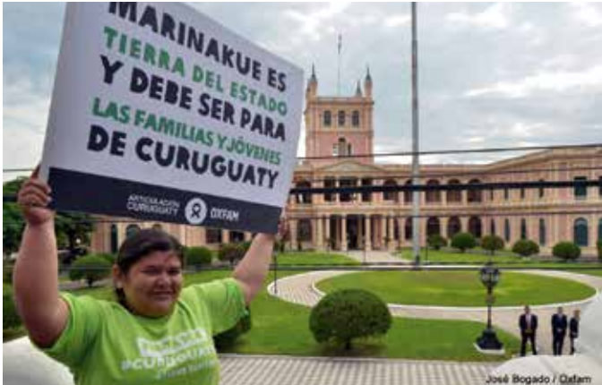
29 abril 2014. Lanzamiento de la campaña internacional de firmas para exigir al Presidente de Paraguay, Horacio Cartes, que entregue a las familias y jóvenes de Curuguaty la propiedad pública de Marinakue.