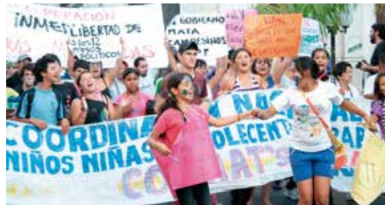
10 de diciembre del 2012 E'a Marcha por los DDHH

El coordinador residente de la ONU en Paraguay pidió al gobierno el esclarecimiento de la matanza durante un acto oficial en conmemoración del Día Internacional de los Derechos Humanos, al que asistieron el presidente paraguayo, Federico Franco, y otras altas autoridades gubernamentales.