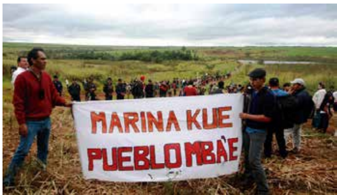
15 de junio del 2013: Primer aniversario de la masacre.