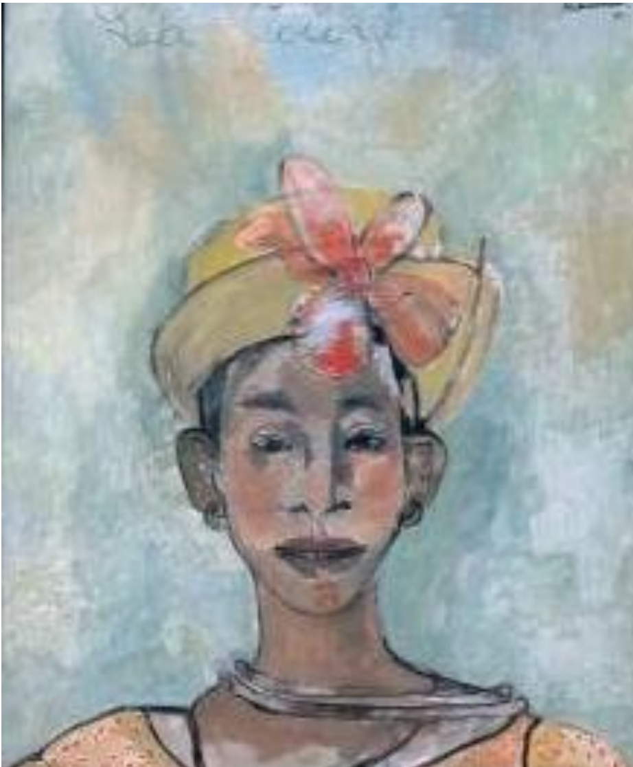
Luce TURNIER, Léa Cocoyé

Le Congrès du Bois Caïman du 14 août 1791 a été un moment d'unification le plus organisé et le plus structuré de la lutte des esclaves contre le mode de production esclavagiste qui alimentait le capitalisme naissant en Europe, notamment en France, mais ces derniers n'ont jamais accepté leur état de déshumanisation. Dans des conditions matérielles difficiles mais dotés d'une conscience politique inébranlable, ils ont forgé la nation haïtienne.