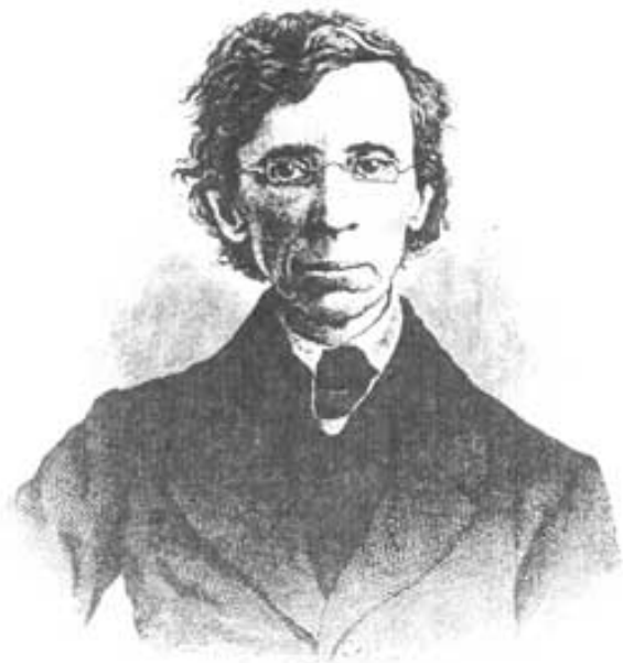
Félix Varela y Morales (1788- 1853)