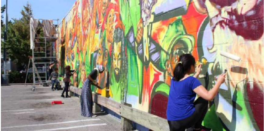
Figura 19: Mural de la Vía Reggae.