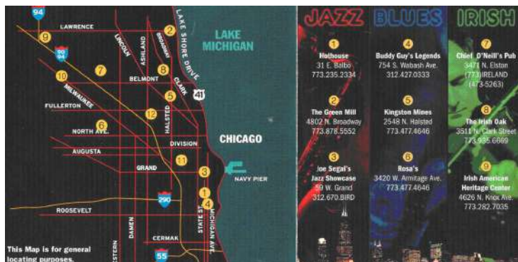
Figura 7: Mapa de la escena musical en Chicago.

Una vez que el turista se ubica en el mismo centro de Chicago, los programas patrocinados por la Oficina de Turismo de Chicago y el Departamento de Asuntos Culturales, tales como los Chicago Neighborhood Tours (CNT) [Recorridos por los vecindarios de Chicago], brindan viajes guiados en autobús que salen del Centro Cultural de Chicago a numerosos enclaves étnicos, como las áreas comerciales judías en la avenida Michigan, vecindarios puertorriqueños en el Parque Humboldt y sitios patrimoniales del blues en el Distrito de Bronzeville del South Side. Como Grazian acertadamente dice, “al capitalizar con nociones exotizadas de etnicidad, comunidad y espacio urbano, estas ‘excursiones en autobús’ transforman las comunidades locales y sus paisajes de interacción social cotidiana en atracciones turísticas comercializadas” (2003, 201).