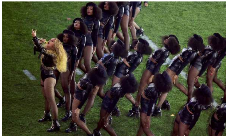
Figura 5: El show de Beyoncé en el Supertazón 2016.

La nueva música de protesta de los cantantes negros es un movimiento cuyo liderazgo, como mantiene Brooks, nos recuerda que el arte que la acompaña debe ser tan espacioso como la ‘negritud’ misma, que es la razón por la cual necesita reconocerse, junto con Beyoncé y Lamar, el poder de resurrección de la música electrónica afrofuturista donde el hip hop de la vieja escuela se encuentra con la nueva escuela y el del gospel se encuentra con el Ritmo y Blues del productor y músico Flying Lotus, “la rebelde con causa Afropunk de ciencia ficción” de la feminista negra homosexual Janelle Monáe, – por citar sólo algunos –, como creadores de una nueva estructura sónica de disidencia negra para la crisis actual (2016, s.n.). El sencillo de Monáe “ Hell You Talmbout ” con firmeza rebate el que se reste importancia a la muerte afroamericanos expresando de manera repetitiva los nombres de sus víctimas. Originalmente se trató de una canción extra de venta exclusiva en la tienda Target en la edición de lujo de su álbum de 2013 The Electric Lady , pero una nueva grabación en 2015 de Monáe transforma la canción en un canto en el que se exhorta al oyente y, en escenarios en vivo, al público, a decir los nombres de las víctimas de la violencia racista. Sobre un ritmo basado en un tambor lo que hace pensar en una marcha militar, la canción consiste en que Monáe y otros artistas de su sello discográfico Wondaland cantan “ Hell You Talmbout ” y apagan la voz principal