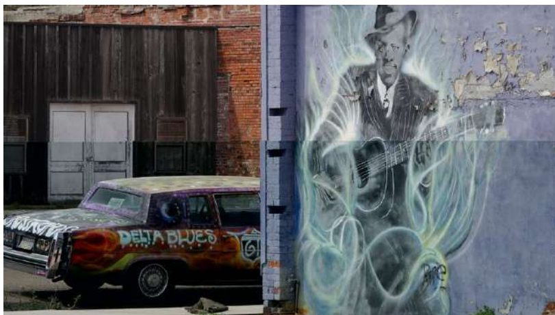
Figura 12: Mural de Robert Johnson en Clarksdale, Misisipi (© Wilfried Rausser 2017).

atraer al visitante a la ciudad de Clarksdale, la región del Delta y sus rutas de blues relacionadas. Como la escultura de Muddy Waters, cuya mirada se dirige hacia el entorno urbano, el frente ampliado del ventanal marca otro sustituto de “lo real”. Señala la reinención del blues en las calles de Clarksdale. Un Cadillac pintado con arte callejero con motivos del Delta y un mural del músico de blues del Delta quizás más mitificado, Robert Johnson, demuestran la nueva movilidad de los tropos del blues.