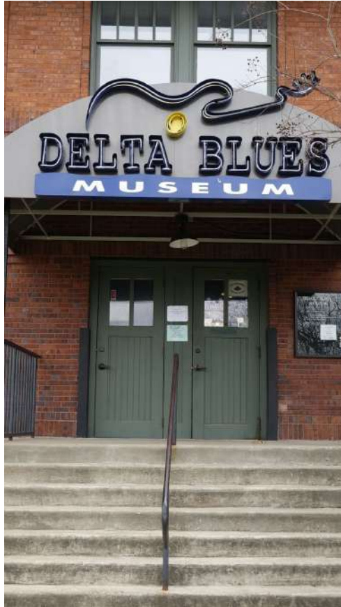
Figura 11: Museo de Blues del Delta, Clarksdale, Misisipi.