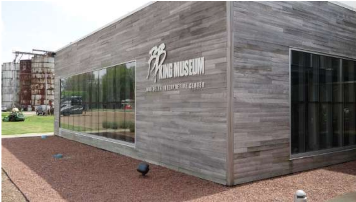
Figura 15: El Museo B.B. King en Indianola, Misisipi.

El Museo B.B. King, sin embargo, es otra historia. Mientras el Museo de blues del Delta y las rutas del patrimonio del blues del Delta carecen de un centro cohesivo, el Museo B.B. King se estableció como la que, sin duda, es la atracción turística más frecuentada del Delta. El museo abrió sus puertas en septiembre de 2008 y “refleja, en parte, la visión de la Fundación y Consejo del Museo B.B. King, un grupo heterogéneo compuesto por blancos y afroamericanos que querían crear una ‘denominación turística crítica en una región que se halla en dificultades’” (King 2011, 17). Económicamente, el proyecto del Museo B.B. King