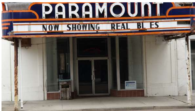
Figura 14: Teatro Paramount, Clarksdale, Misisipi.

cultura de la música popular moderna y contemporánea, el nuevo blues en Clarksdale está más orientado a la producción cultural que al patrimonio cultural. El objetivo es crear cultural y económicamente una nueva cultura del blues que valore a sus héroes de la producción artística tales como la pintura, la escultura y la literatura relacionadas con el blues. Esto crea un nuevo imaginario del blues orientado a mejorar la imagen que tiene la región como un lugar atrasado y racista, y atraer nuevos negocios a Clarksdale y a la región circundante. Sin embargo, el abandonado Teatro Paramount, al que sugestivamente le falta una letra en su marquesina, da a entender que el “blues auténtico” todavía sigue siendo un mito. Parece ser un proceso lento crear una nueva industria cultural y, al mismo tiempo, integrarla a la comunidad.