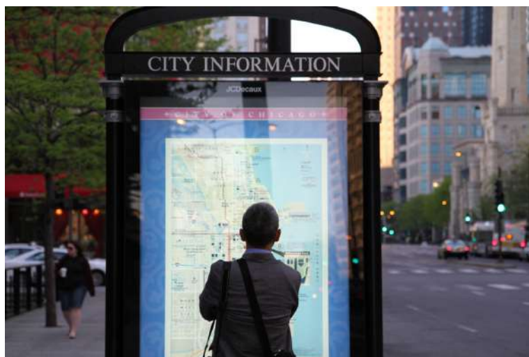
Figura 6: Mapa de imágenes de la ciudad de Chicago.

Una serie de discos editados por ‘Big Chicago’ Records, incluidas colecciones tales como A Chicago Jazz Tour [Un recorrido por el jazz de Chicago], A Chicago Blues Tour [Un recorrido por el blues de Chicago], Hidden Treasures: Irish Music in Chicago [Tesoros escondidos: la música irlandesa en Chicago] y The Chicago Music Scene [La escena musical de Chicago], subrayan el vínculo entre la cultura y los artículos de consumo, y entre la etnicidad y los artículos de consumo, que infunde la posición que se ha impuesto la misma ciudad como atracción turística. Como ilustra el ejemplo de The Chicago Music Scene , la escena musical se define y divide étnicamente en mambo latino, irlandés tradicional, blues afroamericano y jazz como negrura global. Además de una selección de artistas representativos de los diversos géneros, el folleto del disco compacto también proporciona un mapa de la ciudad, llamado acertadamente “mapa localizador de clubes”, que señala los locales musicales patrocinados por la ciudad y que ayuda al turista a abrirse paso por la vida nocturna de Chicago.