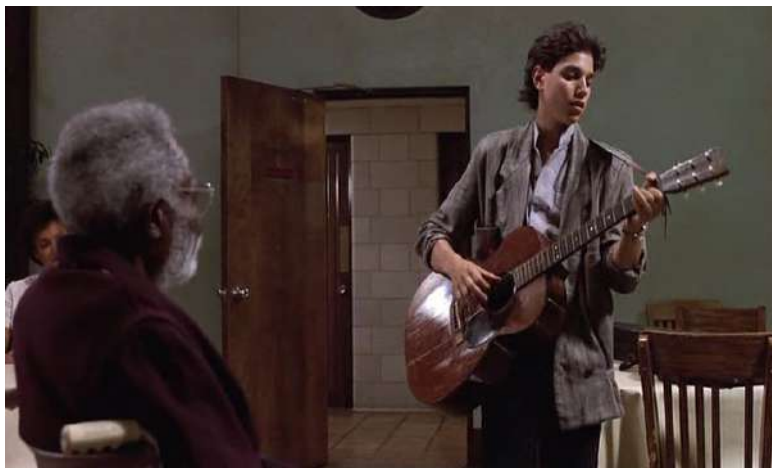
Figura 8: Escena de la película Crossroads : Eugene tocando blues para Willie Brown (Hill 1986, 18:30).

blanco. Asimismo, pone en duda su talento musical para tocar el blues –“Te falta kilometraje. Lo que estás tocando suena como ‘mierda de pájaro’” – y lo acusa de piratería artística – “solo quieres ser otro de esos músicos blancos que roban nuestro patrimonio musical” (Hill 1986, 18:40–19:10). En su crítica de Martin, Willie Brown, al mismo tiempo, fabrica una autenticidad del blues basada en la raza, el lugar y la clase.