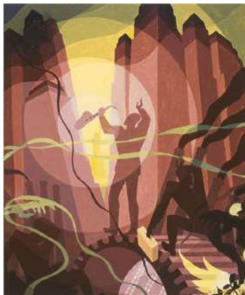
Figura 18: The Song of Towers (La canción de las torres), mural de Aaron Douglas.

Douglas fomentó conscientemente una nueva visión de lo social y lo cultural a través de la divergencia negra. Como resultado de una reunión del comité editorial de la revista Fire!! , Aaron Douglas compuso la siguiente declaración artística en 1925 (cf. 2002):