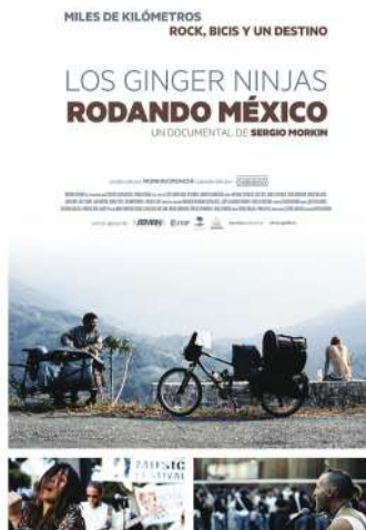
Figura 1: Afiche de la película The Ginger Ninjas Rodando México.

De una manera detallada y muy personalizada, se capta el viaje de la banda de California a México en el documental realizado en 2012 The Ginger Ninjas Rodando México hecho por el director argentino Sergio Morkin.