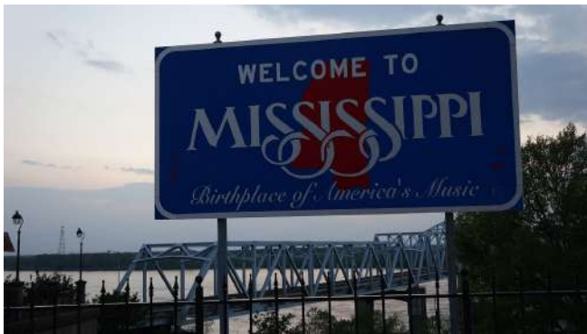
Figura 10: Cartel del bienvenida a Misisipi.