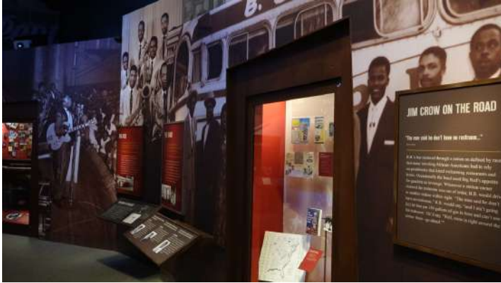
Figura 16: “Jim Crow en el camino,” Museo B.B. King.

No obstante, lo que se busca en general en la narrativa del museo es hacer hincapié en el blues como una música nacional y se aspira a la reconciliación racial al resaltar una unidad esencial entre la tierra, la música y la gente. La narrativa del Museo B.B. King busca ponerle fin; lo hace mediante la incorporación de la tumba de King al terreno y mediante una estructura circular que construye la biografía de B.B. King como una historia de éxito del blues. La narrativa de la exhibición surge de la posición privilegiada del protagonista. Proporciona material histórico como citas, fotografías y objetos materiales desde las guitarras de B.B. King hasta fragmentos de autobuses turísticos. Además, el autobús turístico más reciente de B.B. King sirve ahora como un vehículo para visitas guiadas de blues contemporáneo en el Delta y se encuentra estacionado afuera del museo. Mientras que la narrativa en el Museo de Blues del Delta necesita compensar la falta de material existente para documentar la música y la biografía de Robert Johnson, el Museo B.B. King puede seleccionar qué objetos mostrar y en qué secuencia narrativa. De esta manera, el Museo B.B. King desempeña un papel único en la red de rutas y sitios del blues en la región del Delta: representa la historia de éxito definitiva del blues del Delta en una escala global.