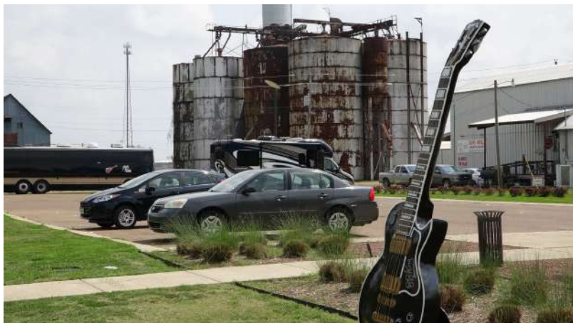
Figura 17: Guitarra ‘Lucille’ y el autobús turístico B.B. King (© Wilfried Raussert 2017).

El Museo B.B. King invita al visitante a una visita circular. El primer cuarto de la exhibición es una pequeña sala de cine que presenta un documental sobre el regreso de B.B. King a Indianola, Misisipi y sus vínculos personales y musicales con el Delta. Después de ver la película, el visitante entra a un cuarto que viaja al pasado al periodo de la infancia de B.B. King y de la industria algodonera en la región del Delta. El concepto estructural es una narrativa circular y cronológica. La voz narrativa – hablada y escrita – es la de B.B. King. Letreros repartidos por todas las salas de exposición contienen citas de B.B. King que permiten que una narrativa autobiográfica en primera persona guíe al visitante en su recorrido. La narrativa personal está vinculada cuidadosamente con la historia de la tierra y de la música. La progresión musical de B.B. King desde el Delta pasando por Memphis hasta Las Vegas y alrededor del mundo se encuentra integrada a una historia de éxito del blues como el pilar musical del desarrollo del rock como música popular a nivel mundial. Cada sección es autónoma como parte de una narrativa cronológica de vida. Cada sección da la bienvenida al espectador con un diseño particular. Si el visitante se desplaza de la sala 1 a la sala 2, la óptica señala un cambio de un escenario rural a uno urbano.