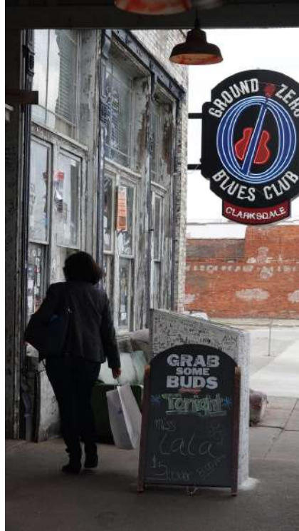
Figura 13: Club de blues Ground Zero en Clarksdale, Misisipi.

lo que muestra a los visitantes que se encuentran en Clarksdale justo en el principio exacto de su viaje hacia la historia del blues.