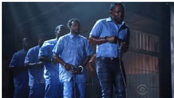
Figura 4: Presentación de Kendrick Lamar en los Premios Grammy 2.