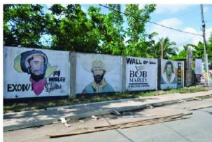
Figura 21: Mural ‘Exodus’ en honor al disco de Bob Marley, Kingston.

Uno de los murales más famosos en Trench Town muestra un mapa de África dentro de la cabeza de Bob Marley, que fuma un cigarrillo de marihuana. El mural hace referencia al álbum de Marley Exodus , lanzado en 1977 y considerado su mayor éxito musical.