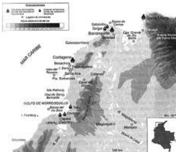
Mapa 2. Lugares para la introducción ilícita de productos de consumo del extranjero en el Estado Soberano de Bolívar

cercanías de Tolú, en especial Isla Fuerte, en la provincia de Sincelejo; las islas de San Bernardo, provincia de Chinú; Zambrano, provincia de El Carmen, y la bahía de Cispatá, provincia de Lorica (Laurent 2008) (ver Mapa 2).