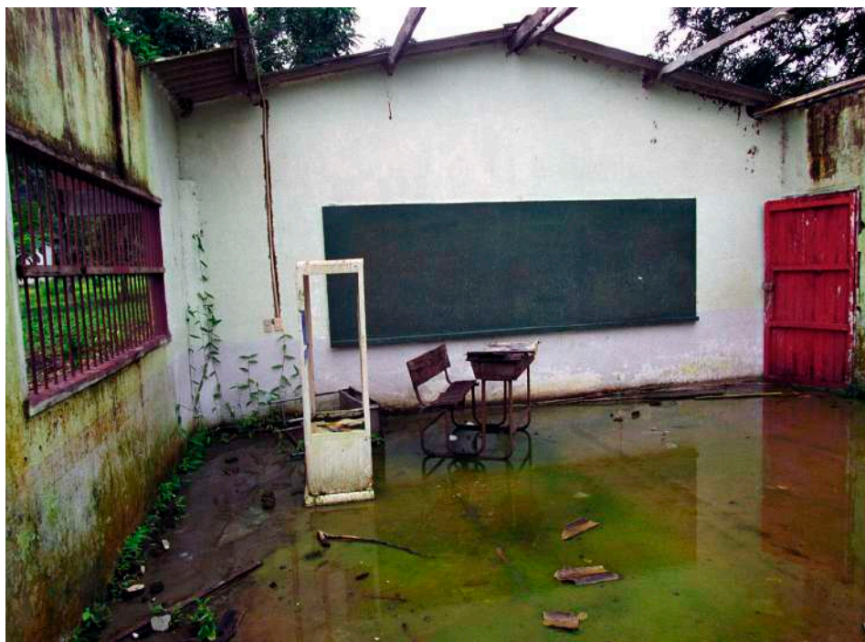
Jesús Abad Colorado. Escuela Caucheras entre Mutatá y Chigorodó, Colombia.