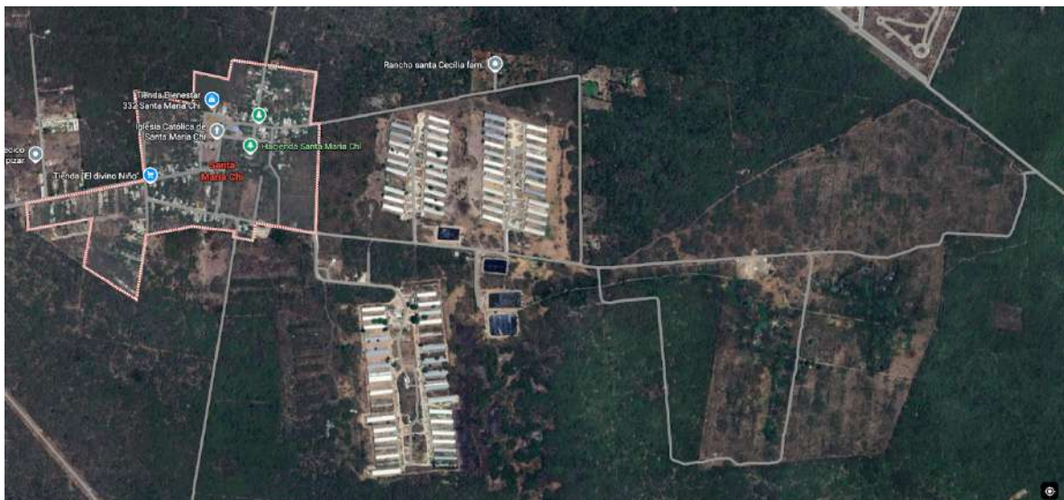
Figura 3: Complejo cárnico, Santa María Chi, Yucatán