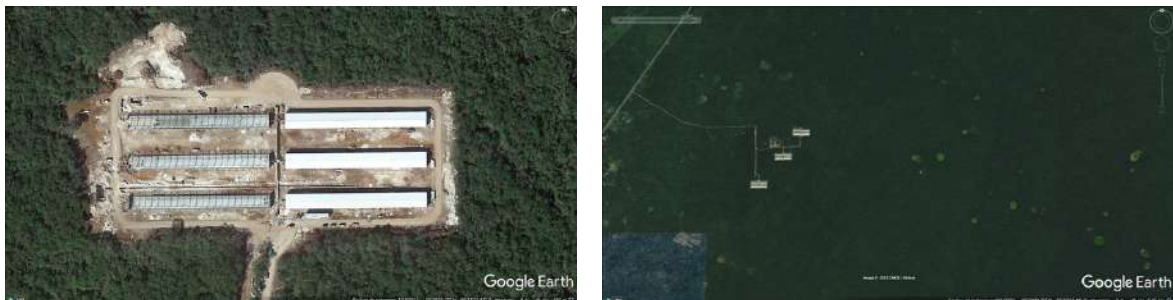
Figura 4: Complejo cárnico, Kopomá Mérida