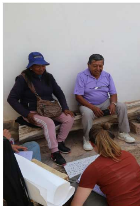
Registros del trabajo en comisiones con integrantes de comunidades y organizaciones indígenas. Instituto Interdisciplinario de Tilcara.