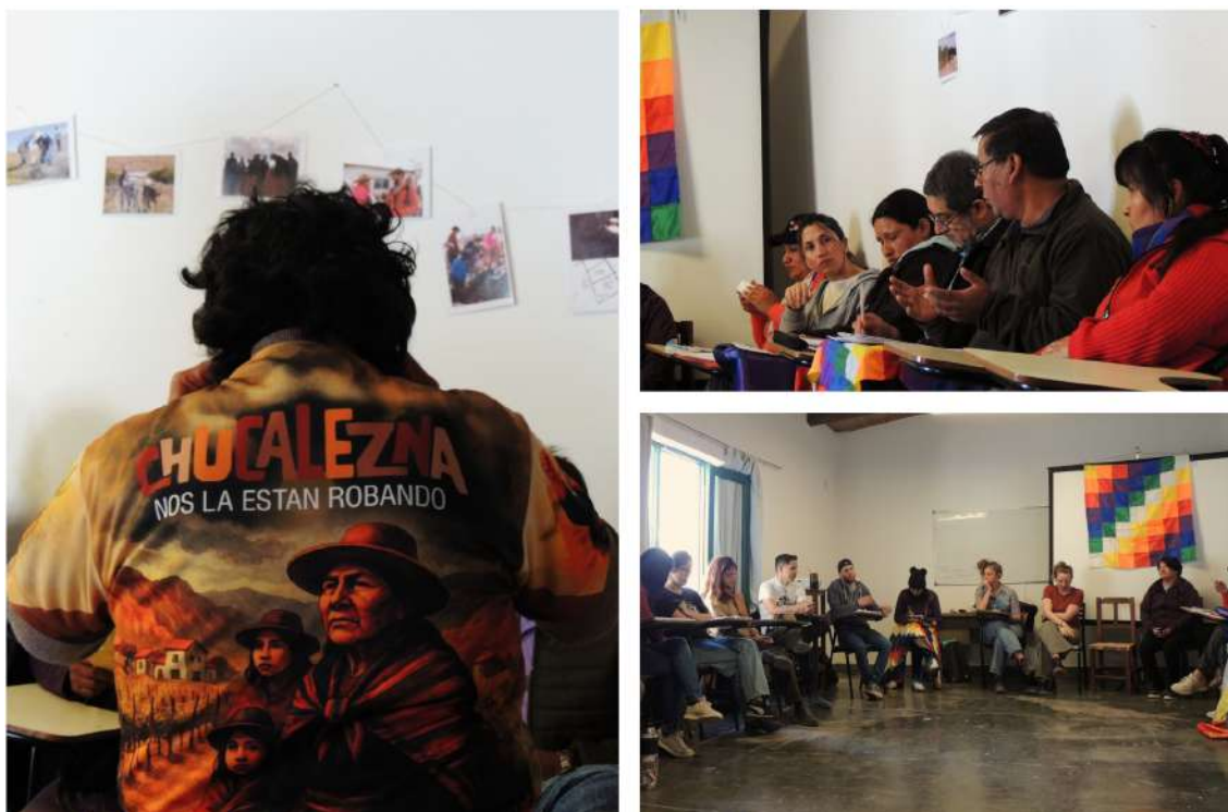
Jornada-Taller, Instituto Interdisciplinario de Tilcara.

Para situar el presente de las comunidades indígenas y sus reclamos, se considera que una lectura histórica puede aportar a la comprensión de ciertos procesos, ya que en muchos casos las demandas se retrotraen a tiempos inmemoriales. Estas se vinculan, por un lado, a experiencias de arraigo territorial fuertemente consolidadas en la memoria familiar y colectiva de las comunidades locales y en documentación historiográfica probatoria, y por otro lado, a los permanentes impedimentos jurídicos para efectivizar o regularizar el reconocimiento de esa relación vital entre el territorio y su gente.