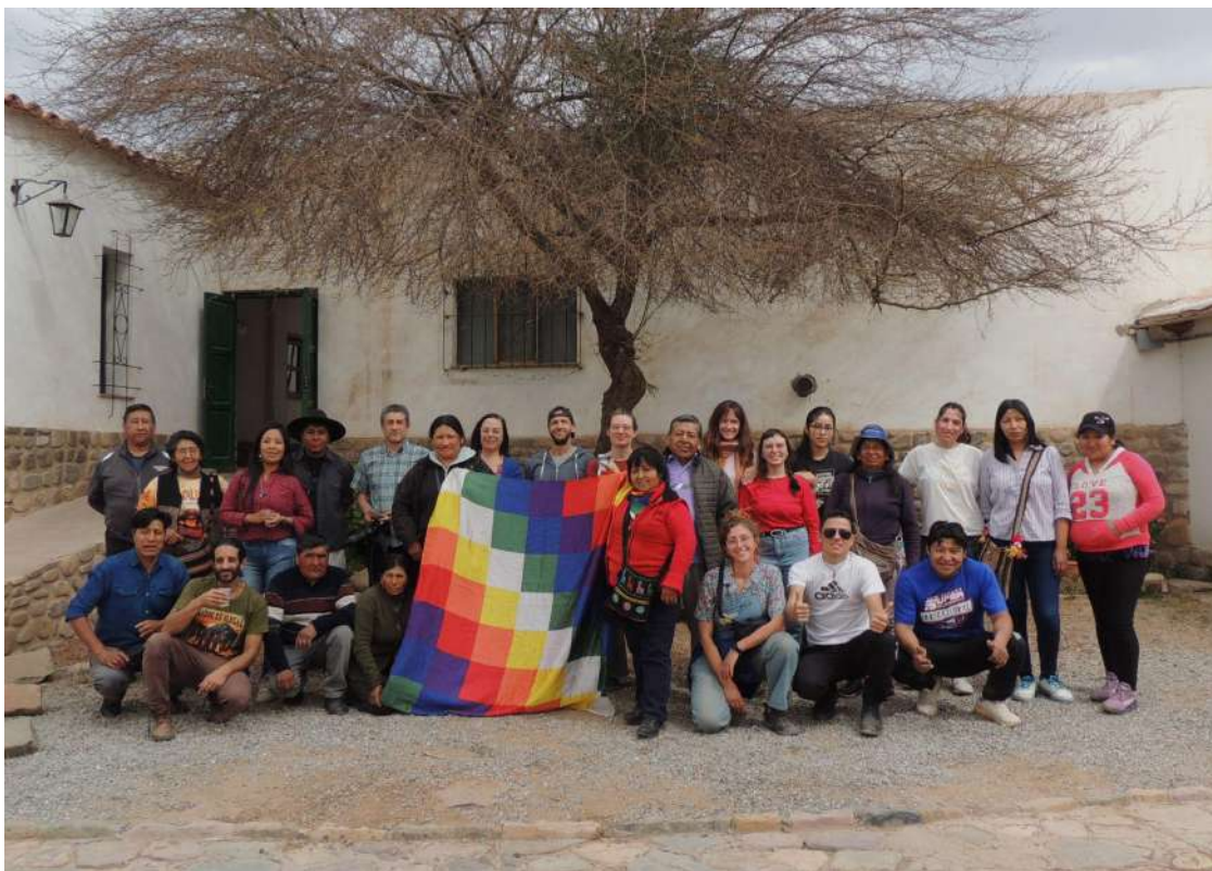
Final de la Jornada-Taller en el Instituto Interdisciplinario de Tilcara. 3 de septiembre de 2025. Integrantes de comunidades indígenas y organizaciones y Equipo de Antropología de las Políticas de Desarrollo y Territoriales (ICA-FFyL-UBA).