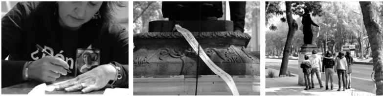
MPJD, Seminario de Medios Múltiples, ENAP, UNAM, Centro Cultural de España, AECID.