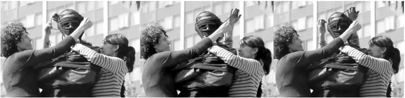
Imagen 53. Stills de video, registro de la acción Cuenda en Paseo de la Reforma, diciembre de 2011, Ciudad de México