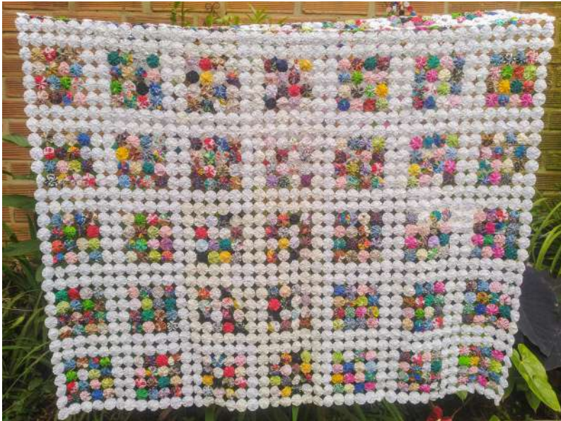
Imagen 7. Detalles de la cobija de Yo-yo de Olga. Cada círculo de tela es un “yo-yo”. La cobija mide aproximadamente 2 x 1,4 metros

Durante una visita a su casa, Olga nos muestra una manta de yoyó, una de las últimas que ha confeccionado. Un yoyó es la forma en que Olga y sus compañeras llaman a la técnica textil que utiliza círculos de tela doblados por el borde y fruncidos, formando una roseta que luego se cose a otros. Una colcha yoyó es una especie de edredón hecho con retales de telas sobrantes de otros proyectos, reutilizando lo que se tiene a mano para producir otra cosa (imagen 7).