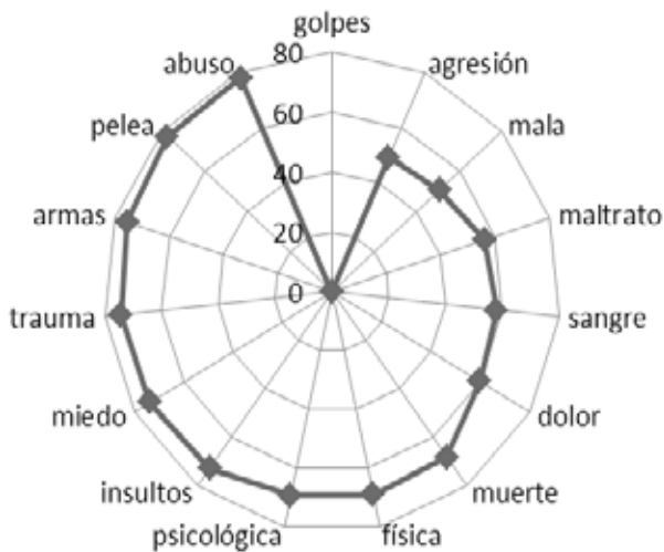
Gráfica 2. Distancia semántica de las definidoras de los jóvenes hombres de bachillerato

Al realizar un análisis más profundo de las definidoras que utilizan los jóvenes y las jóvenes, encontramos que mientras los hombres relacionan la violencia con situaciones de carácter físico y que se sustentan en situaciones sociales que contribuyen a la aparición de estos hechos, las mujeres la relacionan principalmente con características psicológicas y emocionales, situándose como vulnerables ante situaciones de violencia, en las que existe una desigualdad de condiciones (Ver Gráficas 2 y 3). Esto mismo se refleja en los estudios de la SEP, en los que se muestra que el estereotipo típico de hombre y de mujer contempla que él debe ser fuerte y protector de ella, quien es percibida como débil y responsable de las labores propias de organizar a la familia.