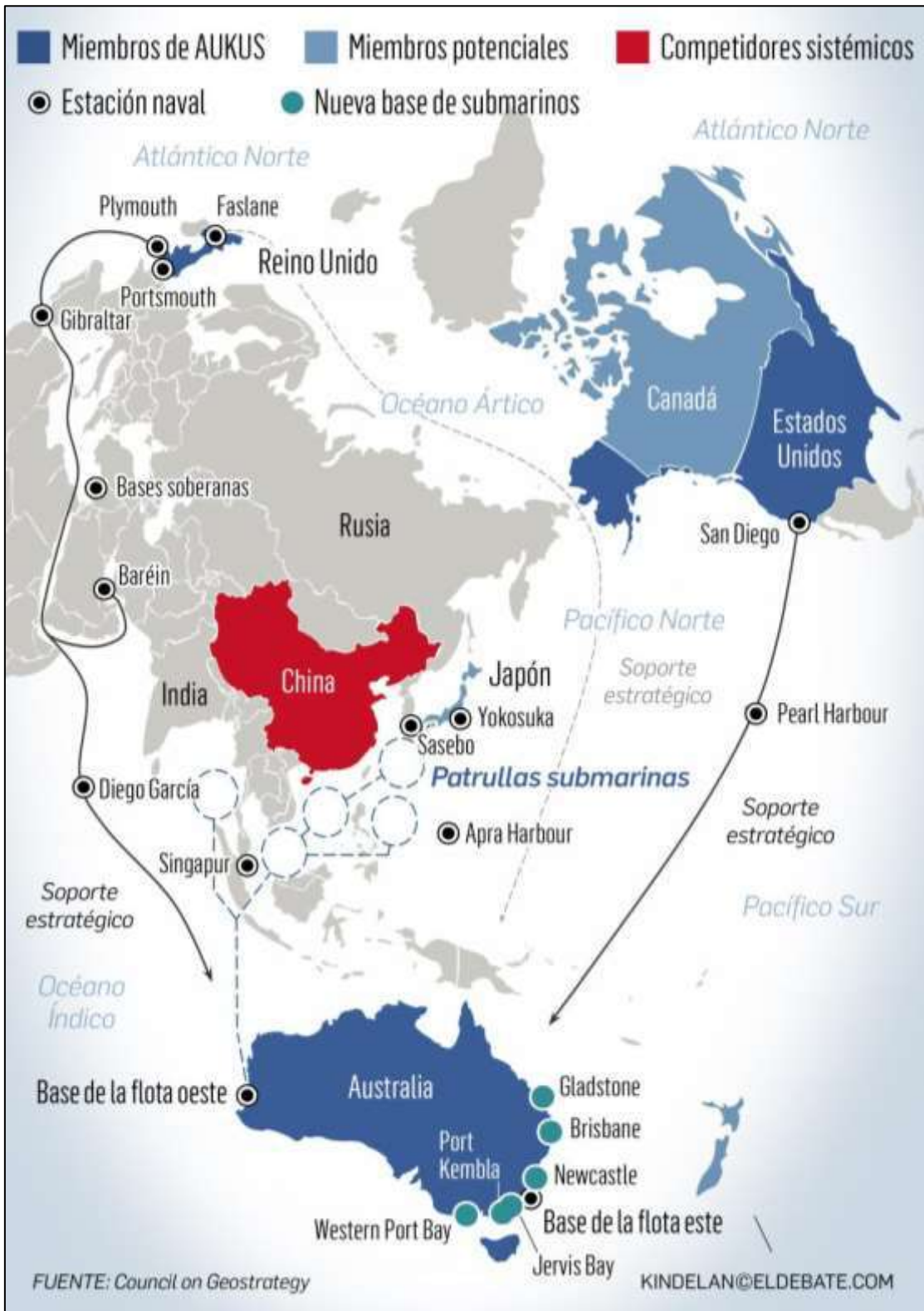
Figura 3. Geografía del AUKUS