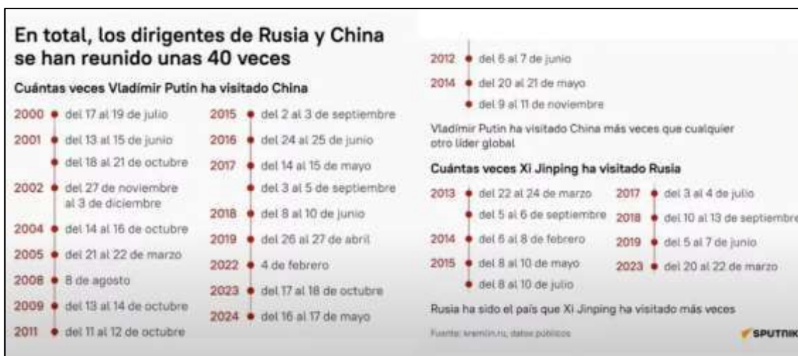
Figura 1. Visitas de Putin a China y Xi Jinping a Rusia

Vladimir Putin y Xi Jinping firmaron una Declaración conjunta sobre la profundización de la asociación estratégica de colaboración integral en la nueva era, con motivo del 75° aniversario del establecimiento de relaciones diplomáticas entre los dos países. El encuentro ocurrió en Pekín en el mes de mayo del presente año.