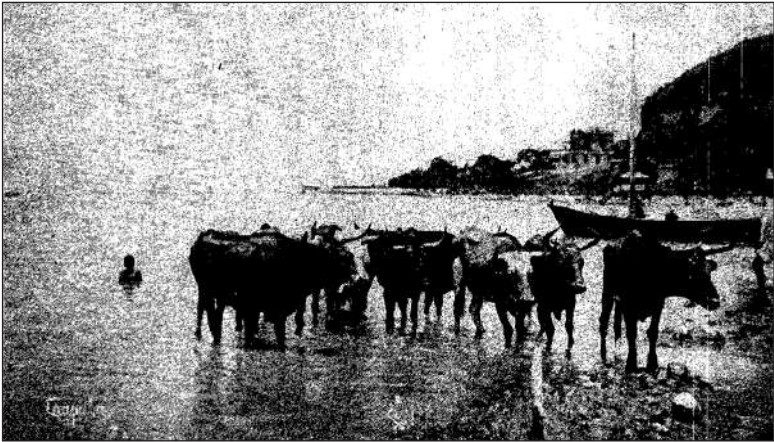
Nuestros panoramas. —Chapala.—

Imágenes 2 y 3: Señas de mexicanidad. Fotografiados de la Revista Moderna de México : un ejemplo de los “Salones de México” (octubre de 1903: 179) y un ejemplo de “Nuestros panoramas” (diciembre de 1903: 232).