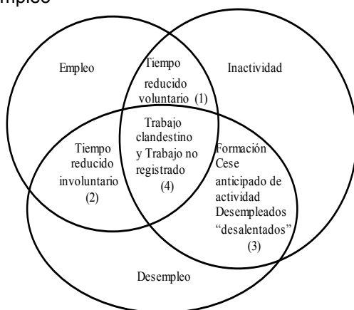
Gráfico N° 4.1. Las superposiciones entre empleo, inactividad y desempleo

Fuente: adaptación de un gráfico tomado de Jacques Freyssinet (1989), Le chômage , La Découverte, Repères, París.