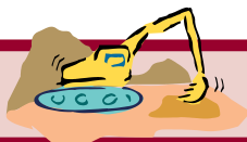
■ Cuadro 1. Evolución prevista de los empleos de la rama "Industria de arenas y agregados"