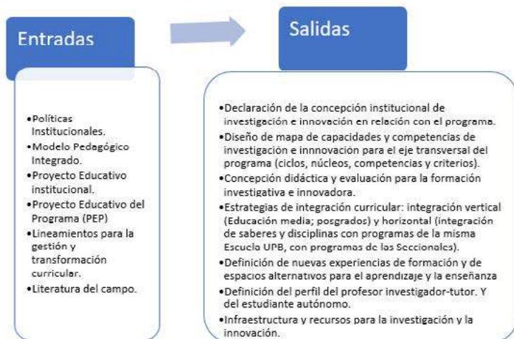
Figura 4. Entradas y salidas