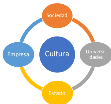
Figura 3. Quíntuple hélice de la Innovación Social

la aplicabilidad de la lógica de la innovación social desde su quíntuple hélice: