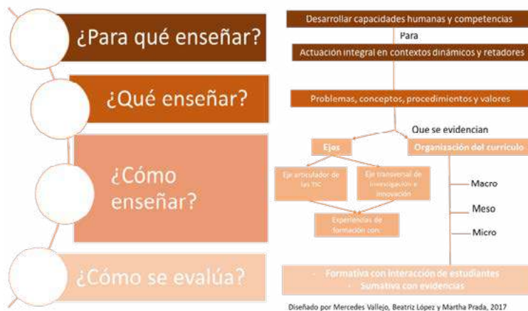
Figura 1. Currículo Innovador en UPB